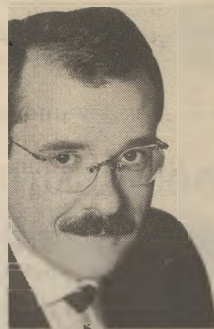
ΤΟΥ ΠΑΥΛΟΥ ΤΣΙΜΑ