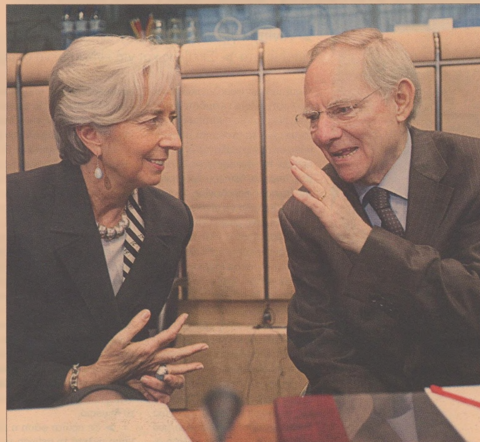
►► H Christine Lagarde με τον Wolfgang Schauble

Ο πρόεδρος Τρισέ ένιωσε ότι θίγεται η ανεξαρτησία της ΕΚΤ και, χάνοντας το συννημένο ήρεμο ύφος του, φώναξε «δεν δέχομαι εντολές». Η καγκελάρια Μέρκελ παρενέβη, τονίζοντας ότι σε καμία περίπτωση δεν θα επιτρέψει η Γερμανία να παραβιαστεί η ανεξαρτησία της κεντρικής τράπεζας. Οι πρωθυπουργοί Ολλανδίας και Φινλανδίας έσπευσαν να συνταχθούν. Η ώρα ήταν περασμένη όταν ο πρόεδρος Van Rompuy προσέφερε και πάλι τον συμβιβασμό: Θα ανακινωνόταν η δημιουργία ενός ευρωπαϊκού «ταμείου σταθεροποίησης», τη λειτουργία του οποίου θα καθόριζαν στη διάρκεια του Σαββατοκύριακου οι υπουργοί Οικονομικών.