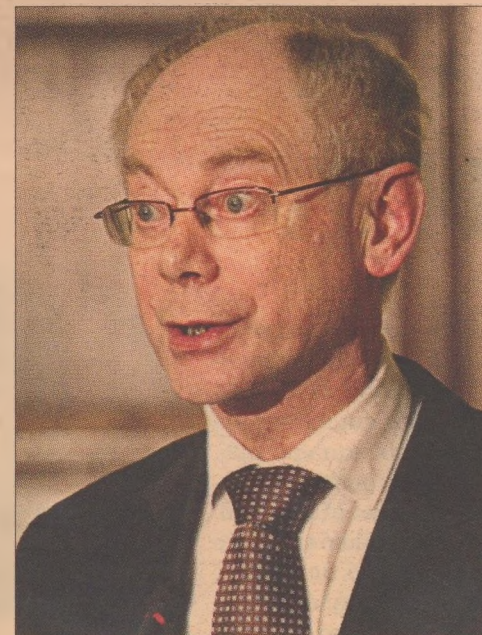
►► Van Rompuy, πρόεδρος της Ε.Ε.