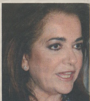
Η κυρία Ντόρα Μπακογιάννη

Η διαχείριση της κατάστασης που διαμορφώνεται μετά την υπαγωγή της χώρας στην επιτήρηση του Διεθνούς Νομισματικού Ταμείου αναδεικνύει τις βαθύτερες αντιθέσεις στο εσωτερικό της Ν.Δ. και είναι αμφίβολο αν ο κ. Αντώνης Σαμαράς μπορεί να ομογενοποιήσει τις διαφορετικές απόψεις. Η πρώτη αντιπαράθεση