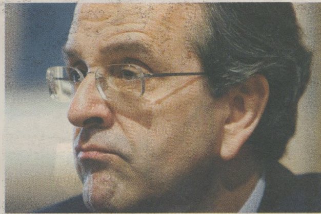
Ο ΠΡΟΕΔΡΟΣ της Ν.Δ. κ. Αντώνης Σαμαράς

Ενώ ο πρωθυπουργός υποστηρίζει ότι «στο ΔΝΤ μας οδήγησε η διακυβέρνηση Καραμανλή», ο κ.