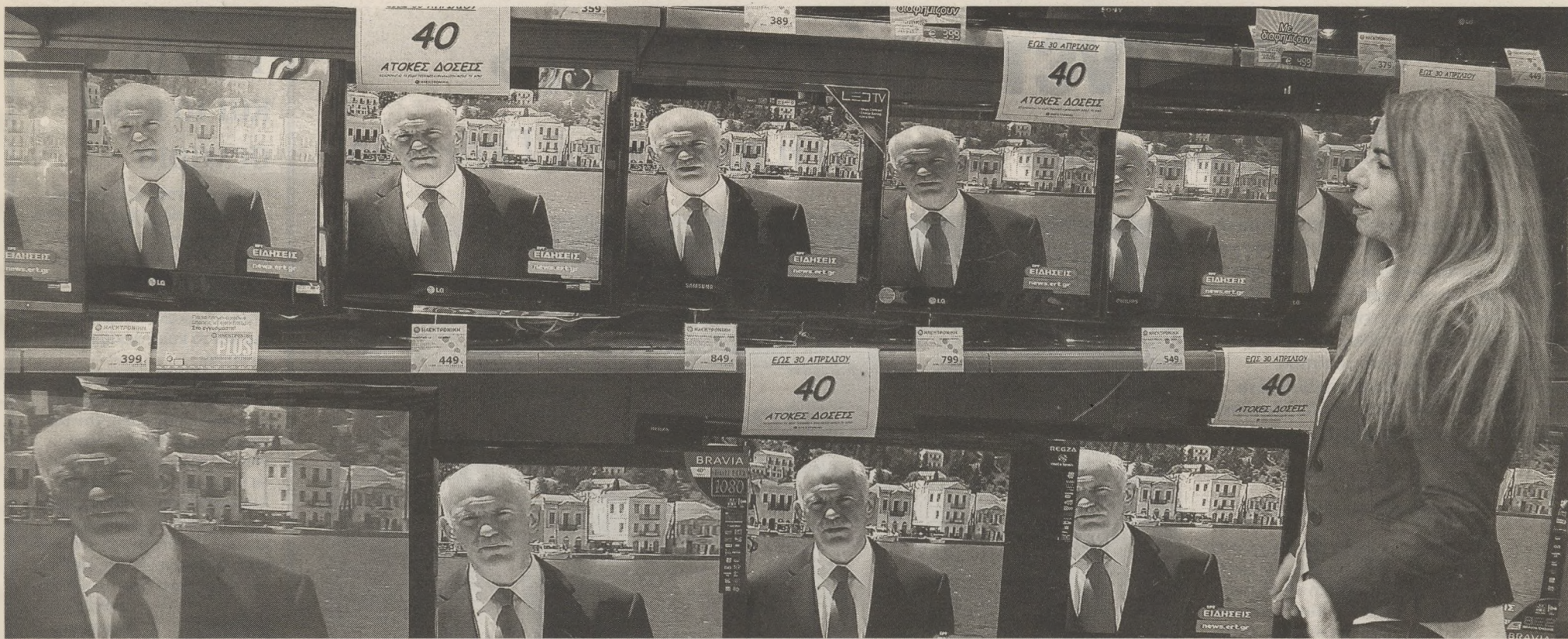
Μια υπάλληλος καταστήματος ηλεκτρικών συσκευών στην Αθήνα παρακολουθεί τη δήλωση του Πρωθυπουργού. «Δεν θα επιτρέψουμε να χαθεί η προσπάθεια που καταβάλλουν οι Έλληνες από τα υψηλά επιτόκια δανεισμού», τόνισε ο Γ. Παπανδρέου

Με διάγγελμα από το Καστελλόριζο ο Πρωθυπουργός πάτησε το κουμπί ενεργοποίησης του μηχανισμού