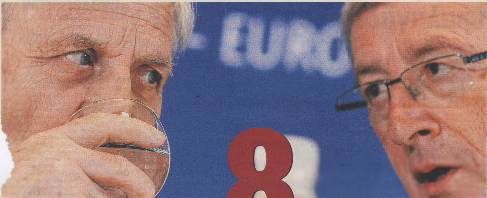
Ο πρόεδρος της Ευρωπαϊκής Κεντρικής Τράπεζας Ζαν - Κλοντ Τρισέ (αριστερά) με τον πρόεδρο του Eurogroup Ζαν - Κλοντ Γιούνκερ. Όλες οι χώρες της ευρωζώνης θα συμμετάσχουν στο πρόγραμμα δανεισμού της Ελλάδας, ανάλογα με το ΑΕΠ τους