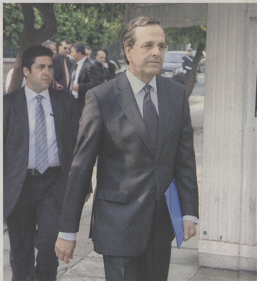
Ο κ. Σαμαράς είναι πεπεισμένος ότι το ΔΝΤ θα ζητήσει από την Αθήνα να λάβει μέτρα που δεν αντέχουν ούτε η κοινωνία, ούτε και η οικονομία.

Όπως είπε και στον πρωθυπουργό Γ. Παπανδρέου στην κατ' ιδίαν συνάν-