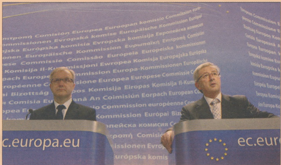
» Ο Ευρωπαϊός Επίτροπος Ολι Ρεν (αριστερά) με τον πρόεδρο του Eurogroup Ζ.Κ. Γιούνκερ κατά την συνέντευξη Τύπου για τον μηχανισμό στήριξης την προηγούμενη Κυριακή

Δηλώσεις στην «Η» από πηγές προσκείμενες στον Ευρωπαϊό επίτροπο Ολι Ρεν