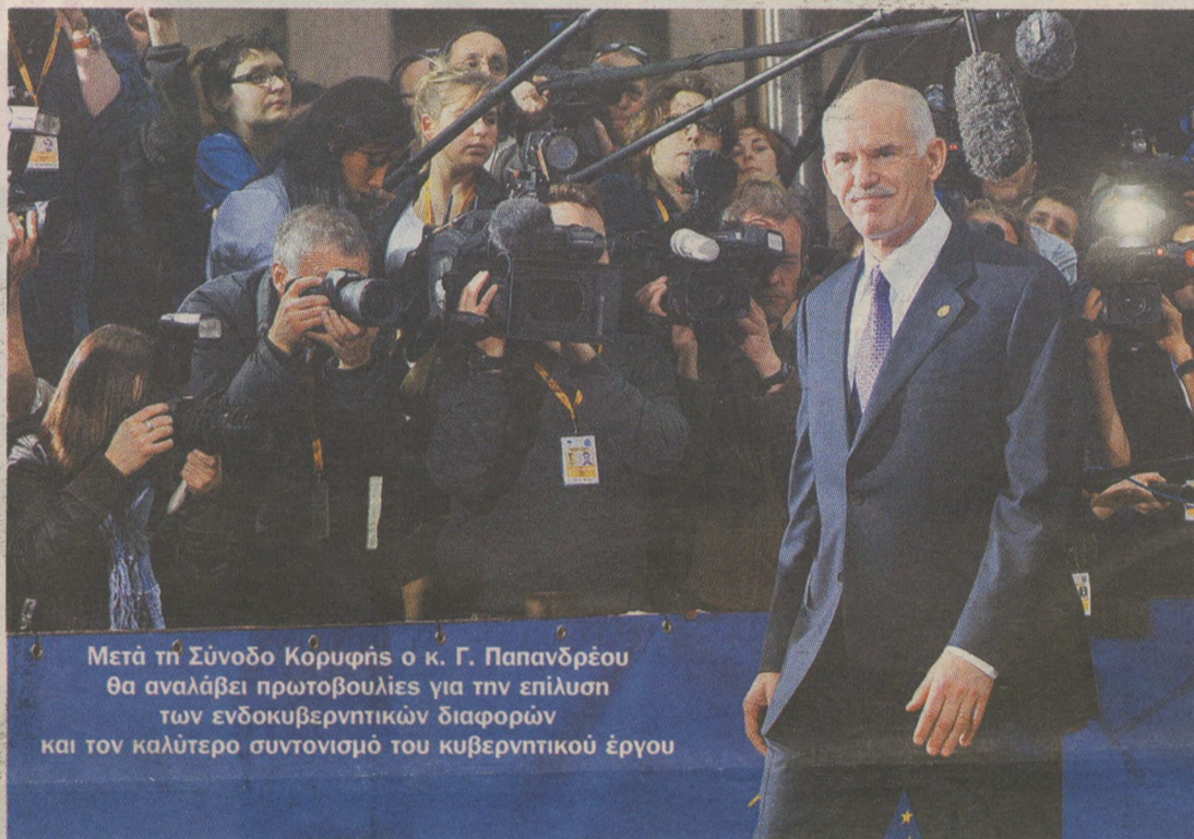
Μετά τη Σύνοδο Κορυφής ο κ. Γ. Παπανδρέου θα αναλάβει πρωτοβουλίες για την επίλυση των ενδοκυβερνητικών διαφορών και τον καλύτερο συντονισμό του κυβερνητικού έργου

Κατά συνέπεια ενισχύεται η εκτίμηση ότι ο «σκληρός Απρίλης του '10» θα κρίνει το κεντρικό πολιτικό στοίχημα της χρονιάς, το οποίο είναι η στήριξη της πραγματικής οικονομίας σε επίπεδα που θα επιτρέψουν στον Πρωθυπουργό να