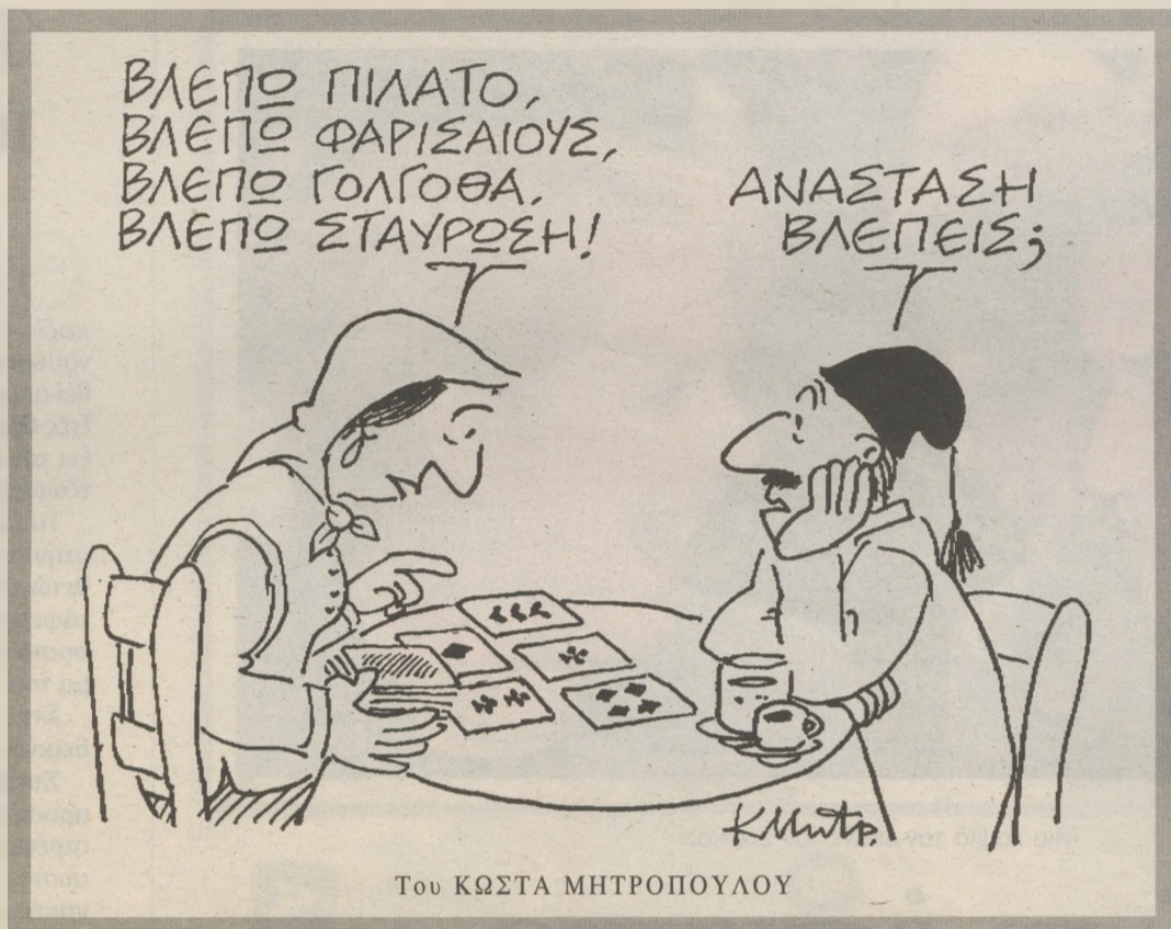
Του ΚΩΣΤΑ ΜΗΤΡΟΠΟΥΛΟΥ

Τ ο θέμα ανήκει στις αρμοδιότητες της κυρίας Λούκας Κατσέλη , αλλά θεωρείται «κεντρι-