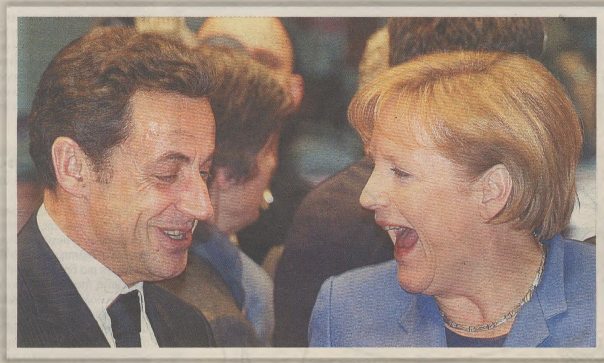
Μια χαψιά τον έκανε τον Σαρκοζί

Του Ι. Κ. ΠΙΠΕΤΕΝΤΕΡΗ jpretentis@dolnet.gr