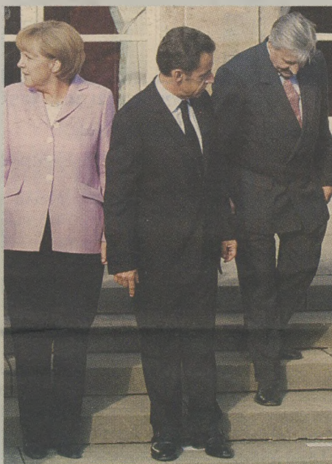
Μέρκελ, Σαρκοζί, Τρισέ. Κανένας τους δεν κοιτάζει τον άλλον. Και όμως. Και οι τρεις γνωρίζουν το αντισχέδιο - και κάνουν πως δεν το γνωρίζουν για τη στήριξη της Ελλάδας κατά των σχεδίων των κερδοσκόπων

Οι Ευρωπαίοι γνωρίζουν το σχέδιο και τις πεπονόφλουδες των αγορών. Γι' αυτό και αποφεύγουν «σαν ο διάβολος το λιβάνι» να κάνουν δηλώσεις στήριξης. Αντίθετα, μάλιστα, προβαίνουν σε δηλώσεις ότι δεν θα βοηθήσουν και ότι η Ελλάδα «θα πρέπει να λύσει μόνη τα προβλήματά