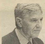
ΤΟΥ Τ. ΓΙΑΝΝΙΤΣΗ

«Χρειαζόμαστε τα κονδύλια»: διαμαρτυρία στο Ιλινόι εναντίον της κυβερνητικής απόφασης να μειωθούν τα κονδύλια για τις κοινωνικές υπηρεσίες προκειμένου να αντιμετωπιστεί το δημοσιονομικό έλλειμμα ύψους 9,2 δισ. δολαρίων