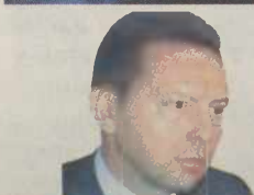
ΤΟΥ Ι. ΣΤΟΥΡΝΑΡΑ