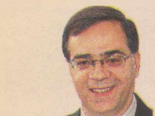
ΤΟΥ Γ.Κ. ΧΑΡΔΟΥΒΕΛΗ

Ο κ. Ιωάννης Στουρνάρας είναι καθηγητής Οικονομικών στο Πανεπιστήμιο Αθηνών, επιστημονικός διευθυντής του ΙΟΒΕ.