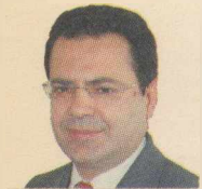
ΤΟΥ Δ. ΧΙΟΝΗ

Π αρά το γεγονός ότι η οικονομία συνεχίζει να αποτελεί ένα σημαντικό μέρος της προεκλογικής πολιτικής αντιπαράθεσης, παραμένουν ακόμη αναπάντητα σημαντικά ερωτήματα που σχετίζονται με την αντιμετώπιση της κρίσιμης κατάστασης της οικονομίας. Ετσι ενώ στο διεθνές και ευρωπαϊκό σκηνικό αρχίζουν να προδιαγράφονται οι προϋποθέσεις για τη σταθεροποίηση και να δημιουργούνται κάποια σημάδια ανάκαμψης των οικονομιών, στην Ελλάδα οι εξελίξεις δεν επιτρέπουν αισιόδοξα σενάρια.