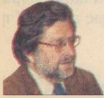
ΤΟΥ Ν. ΜΟΥΖΑΛΗ

1 Η ΝΔ και το ΠαΣοΚ θέτουν το οικονομικό πρόβλημα της χώρας στο κέντρο της εκλογικής στρατηγικής τους. Η έμφαση στην οικονομία είναι σωστή αφού η έξοδος από την κρίση και η αύξηση του παραγόμενου πλούτου είναι η αναγκαία (αν όχι και ικανή) προϋπόθεση για τη λύση μιας σειράς καιρίων προβλημάτων στον χώρο της παιδείας, της υγείας, της κοινωνικής ασφάλισης, της έρευνας κτλ. 2 Η οικονομική κρίση στη χώρα μας έχει και εξωτερικά (παγκόσμια ύφεση) αλλά και εσωτερικά αίτια (χαμηλή παραγωγικότητα και ανταγωνιστικότητα της οικονομίας). Η ΝΔ για προφανείς λόγους δίνει μεγαλύτερη έμφαση στην εξωτερική διάσταση του προβλήματος, ενώ το ΠαΣοΚ στην εσωτερική. Βέβαια τους ψηφοφόρους τούς ενδιαφέρει λιγότερο το βάρος που θα δώσει κανείς στους εξωτερικούς και εσωτερικούς παράγοντες και περισσότερο με ποιον τρόπο θα βγούμε από την κρίση.