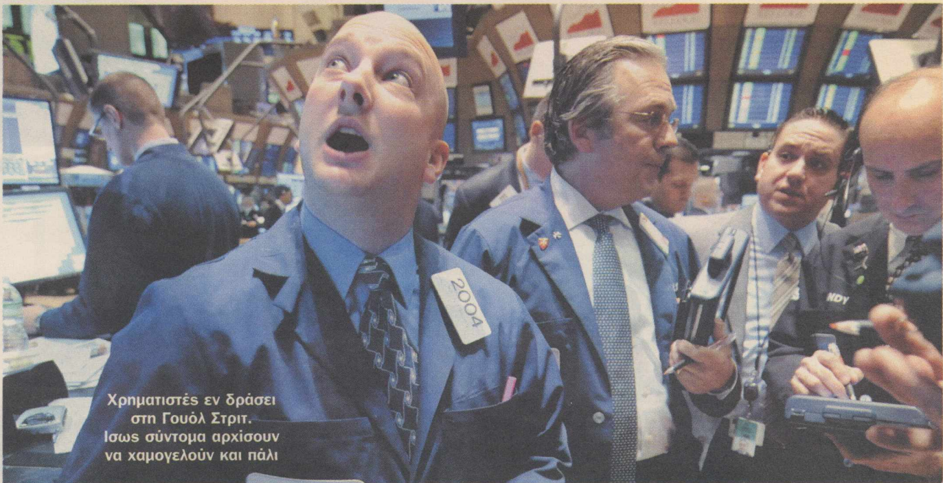
Χρηματιστές εν δράσει στη Γουόλ Στριτ. Ίσως σύντομα αρχίσουν να χαμογελούν και πάλι