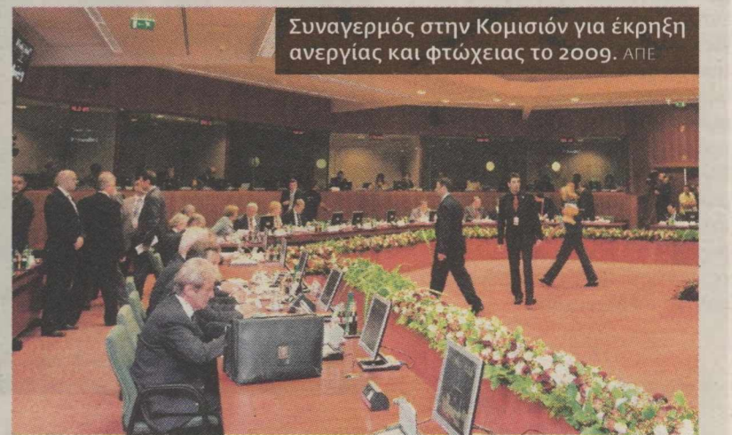
Συναγερμός στην Κομισιόν για έκρηξη ανεργίας και φτώχειας το 2009.

Απρίλιος Η Eurostat θα αποφανθεί οριστικά εάν το έλλειμμα του 2008 ξεπέρασε το όριο της επιτήρησης. Σε αυτή την περίπτωση θα εισηγηθεί στην Κομισιόν την έναρξη της διαδικασίας.