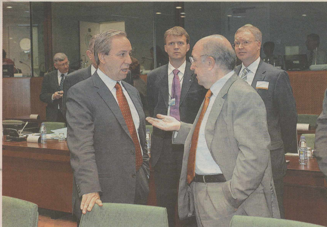
Ο υπουργός Οικονομίας (στη φωτογραφία με τον αρμόδιο επιτροπο για τις Οικονομικές και Νομισματικές Υποθέσεις Χοακίν Αλμουνία) φοβάται την «τιμωρία» των αγορών και αντιδρά στις πιέσεις για γενικευμένη χαλάρωση

Επί του παρόντος το υπουργείο Οικονομίας και Οικονομικών επε-