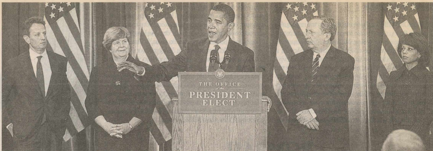
Ο Μπαράκ Ομπάμα μιλάει στους δημοσιογράφους ενώ παρακολουθούν (από αριστερά) οι Τίμοθι Γκάιτνερ, νέος υπουργός Οικονομίας, Κριστίνα Ρόμερ, νέα επικεφαλής του Σώματος Οικονομικών Συμβούλων του Λευκού Οίκου, Λόρενς Σάμερς, ο οποίος ανέλαβε και επίσημα την ηγεσία του Εθνικού Οικονομικού Συμβουλίου, και Μέλοντι Μπαρνς, νέα επικεφαλής του Συμβουλίου Εσωτερικής Πολιτικής

Με βάση αυτή την κεντρική πολιτική κατεύθυνση είναι σαφές ότι για την ελληνική οικονομία τα περιθώρια είναι εξαιρετικά περιορισμένα αφού τόσο το δημόσιο χρέος όσο και το εξωτερικό ισοζύγιο δεν της δίδουν τη δυνατότητα να χρηματοδοτήσει τα αναγκαία για την αντιμετώπιση της κρίσης αναχώματα. Τομείς όπως ο τουρισμός και η ναυτιλία, που σίγουρα θα υποφέρουν το 2009, ίσως δε και το 2010, δεν θα ενισχυθούν επαρκώς, ενώ οι όποιες ενισχύσεις επιτραπούν από τις Βρυξέλλες θα επιτραπούν υπό συγκεκριμένους όρους και με συμπεφωνημένες διαρθρωτικές μεταρρυθμίσεις ώστε να μη γίνει σε λίγα χρόνια η Ελλάδα Ουγγαρία.