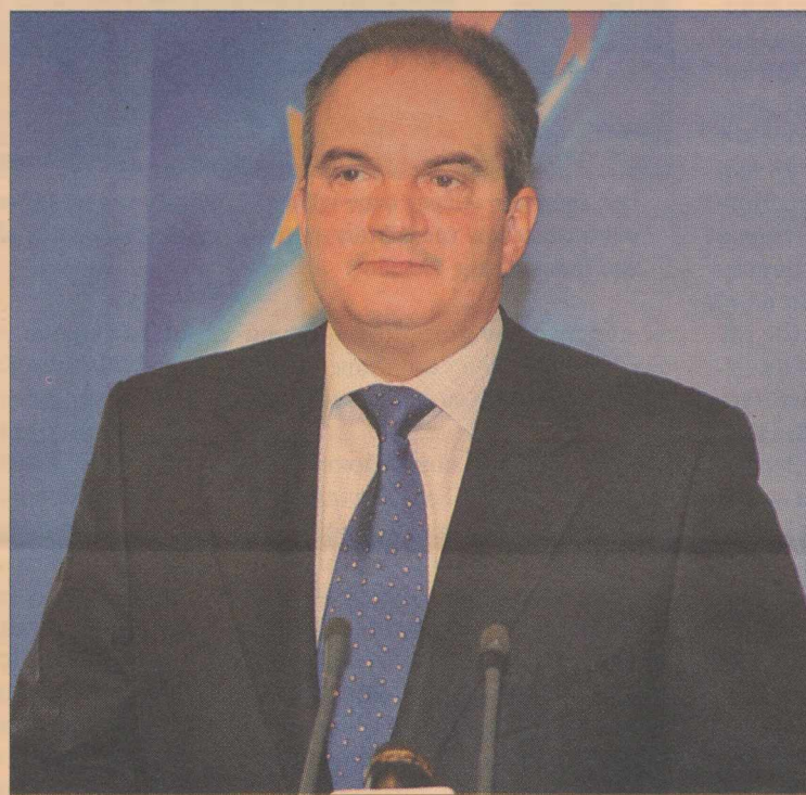
» Το παράδειγμα του Βρετανού πρωθυπουργού που εξήγγειλε μία σειρά μέτρων, όπως η μείωση του ΦΠΑ και φοροαπαλλαγές, επιθυμεί η αγορά να ακολουθήσει ο Έλληνας πρωθυπουργός, Κ. Καραμανλής

Από την πλευρά του, ο υπουργός Οικονομίας Γ. Αλογοσκούφης μιλώντας στην «ώρα της ελληνικής