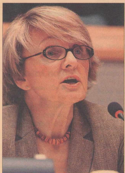
Η επίτροπος για την περιφερειακή πολιτική Ντανούτα Χούμπνερ

Σε κάθε περίπτωση πάντως, επειδή στην παρούσα φάση και χωρίς το πακέτο στήριξης των 28 δισ. ευρώ σε πολλές τράπεζες οι περικοπές των χορηγήσεων έχουν λάβει μεγάλες διαστάσεις, η έναρξη λειτουργίας του πακέτου εκτιμάται ότι μόνον βελτίωση μπορεί να επιφέρει στις τρέχουσες συνθήκες.