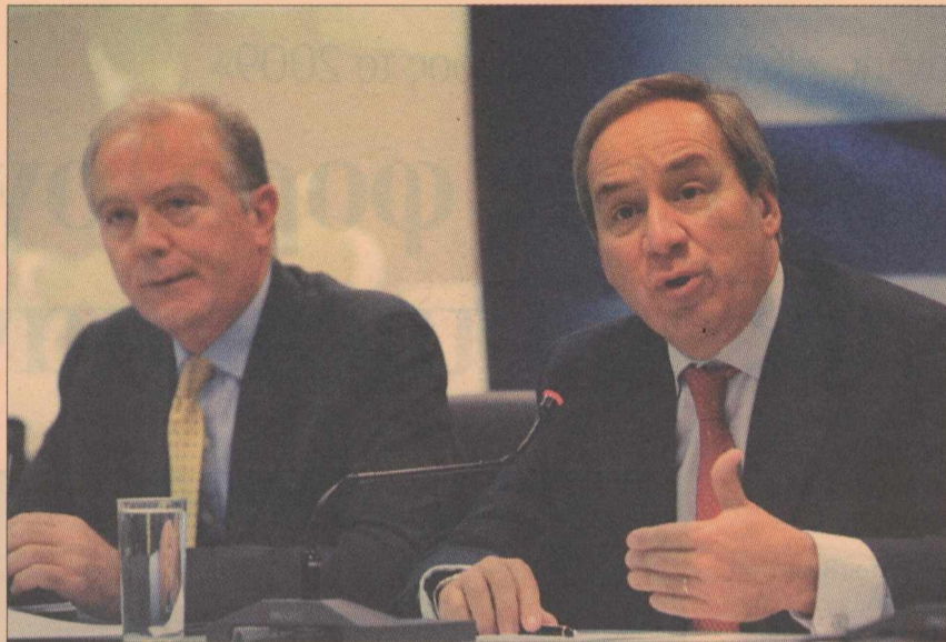
Στις επόμενες ημέρες στην εβδομάδα αναμένεται να λάβουν χώρα μία σειρά συναντήσεων των τραπεζιτών με το υπουργείο Οικονομίας αλλά και με τη διοίκηση της Τράπεζας της Ελλάδος.

Ο χρονικός ορίζοντας της εισόδου τους δεν είναι απολύτως διευκρινισμένος και θα εξαρτηθεί εν πολλοίς από