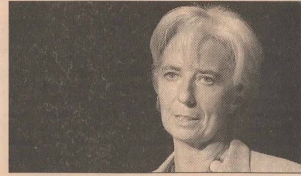
«Πρόκειται για τις ιστορικά χαμηλότερες εκτιμήσεις, ενώ δεν αποκλείεται ο ρυθμός ανάπτυξης να διαμορφωθεί και σε ακόμα χαμηλότερα επίπεδα», διευκρίνισε η Γαλλίδα υπουργός Οικονομικών Κριστίν Λαγκάρντ.