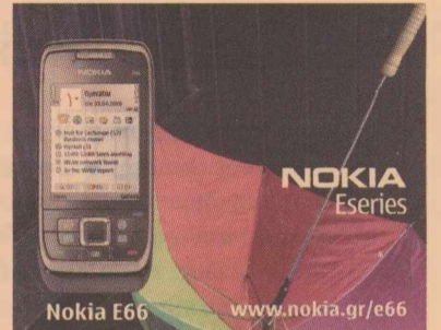
Nokia E66 www.nokia.gr/e66

Δύο αρνητικά ρεκόρ για την οικονομία των ΗΠΑ: Συρρίκνωση κατά 0,3% του ΑΕΠ το γ' τρίμηνο και, η μεγαλύτερη μείωση από το 1980, (-3,1%) στην κατανάλωση > σελ. 12