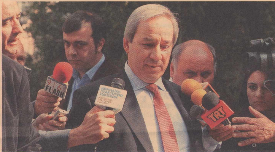
Ο Γ. Αλογοσκούφης θα προεδρεύει στο Συμβούλιο Εποπτείας Εφαρμογής

ελληνικής οικονομίας, μέσω της αύξησης των δημοσίων επενδύσεων. Αν και ο υπουργός απέφυγε να αναφερθεί ευθέως στο Πρόγραμμα Δημοσίων Επενδύσεων, πιθανότατα να το πράξει σήμερα ο πρωθυπουργός στην προημερησίως διάταξης ομιλία του στην Βουλή, εν τούτοις επικεντρώθηκε στην ανάγκη ενίσχυσης της ρευστότητας σε έργα παραχώρησης, αλλά και σε έργα που εκτελούνται μέσω του ΣΔΙΤ.