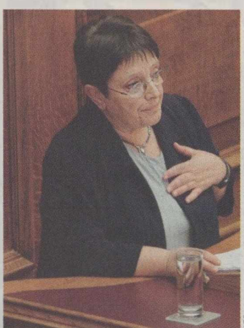
«Το σύστημα πρέπει να υποστεί κλονισμό, δεν διορθώνεται με μπαλώματα», είπε η κ. Παπαρήγα.

«Το σύστημα πρέπει να υποστεί κλονισμό, δεν διορθώνεται με μπαλώματα», ήταν το κεντρικό μήνυμα που θέλησε να περάσει μέσω της δικής της παρέμβασης η κ. Αλέκα Παπαρήγα. Η γραμματέας του ΚΚΕ έκρινε σκόπιμο εξαρχής της ομιλίας της να καταστήσει απολύτως σαφείς τόσο τις διαφορές της πολιτικής της έναντι του ΠΑΣΟΚ, όσο κυρίως του ΣΥΡΙΖΑ, κατηγορώντας μάλιστα τον κ. Αλ. Αλαβάνο ότι «μόνον ακροθιγώς αναφέρθηκε στην τεράστια απειλή του εργασιακού χρόνου που μας γυρίζει στο 19ο αιώνα». Παρομοίωσε δε με «λαγό της επερχόμενης κυβερνητικής λαιλαπας» τον πρόεδρο του ΕΒΕΑ κ. Κ. Μίχαλο, ενώ με απαξιωτικό τρόπο αντιμετώπισε και το εναλλακτικό σχέδιο του κ. Γ. Παπανδρέου. «Δεν λύνονται τα προβλήματα των εργαζομένων με πράσινη ανάπτυξη», είπε.