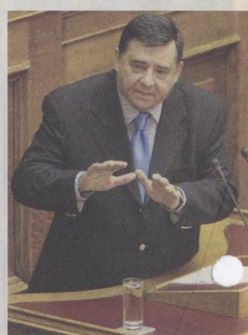
Γ. Καρατζαφέρης: «Όταν ο αντίπαλός μου διακρύζει, εγώ δεν του βάζω βελόνα στο μάτι»

Και στο πλαίσιο αυτό εμπέδωσε πλην σαφώς είπε ότι επιθυμία του δεν είναι να χτυπήσει την κυβέρνηση: «Όταν ο αντίπαλός μου διακρύζει, εγώ δεν του βάζω