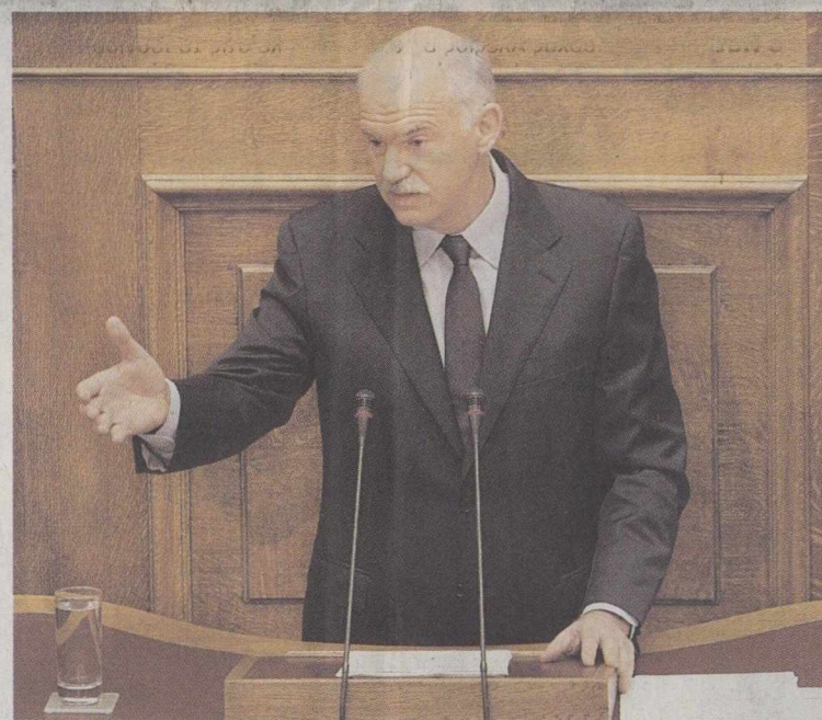
«Σκανδαλώδη πολιτική από κυβέρνηση σκανδάλων», βλέπει ο κ. Παπανδρέου.