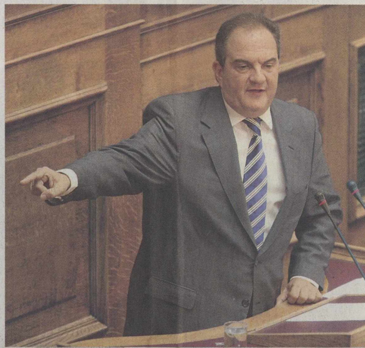
Ο κ. Καραμανλής δεν θα θέσει εν αμφίβολη τη δημοσιονομική ισορροπία.