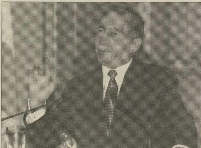
Και αυτός στο... στόχαστρο από τον τέως πρωθυπουργό

πραγμάτων, απορροφημένος από τους μεγαλεπήβολους στόχους που είχε θέσει, ο τέως πρωθυπουργός, δεν κατάφερε όχι μόνο στο κόμμα του - στο οποίο έτσι κι αλλιώς πάντα αισθανόταν κάπως σαν «ξένο σώμα» να ελέγξει αλλά ούτε και την κυβέρνηση του, εξ ου και η γιγάντωση των φαινομένων διαφθορά, παρά την αδιαμφισβήτητη προσωπική εντιμότητα του ίδιου του κ. Σημίτη.