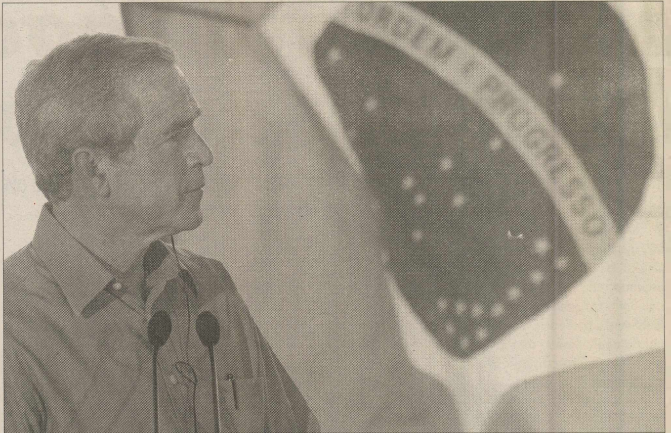
Ανεπιθύμητος μέσα και έξω