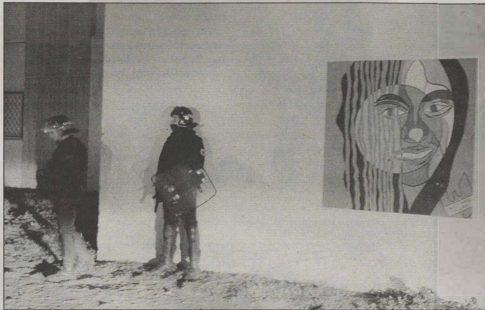
Το πρόσωπο της εξέγερσης στη Γαλλία

Τ Ο ΠΟΛΥΑΝΑΜΕΝΟΜΕΝΟ βιβλίο του Κ. Σημίτη δεν μας έκανε σε τίποτα σοφότερους. Η αυτοκριτική του περιορίζεται σε μια γενική αναφορά περί αυτοκριτικής και της «δύναμης που (αυτή) δίνει». Λάθη, όμως, δεν υπήρχαν στις κυβερνήσεις του πρώην πρωθυπουργού, λάθη δεν έκανε ο ίδιος, για όλα φταίνε μόνο οι «άλλοι», όπως ο ναύαρχος Λυμπέρης (Ίλια) ή αυτοί που δεν καταλάβαιναν τη διαρκή διεργασία του « εκσυγχρονισμού » του! Θα περίμενε κανείς πως ο Κ. Σημίτης, απαλλαγμένος από τη « λογοκρισία » της εξουσίας και των όποιων μελλοντικών εξουσιαστικών προσδοκιών του, θα ήταν πιο αποκαλυπτικός, ότι θα έλεγε τα « πράγματα με τ' όνομά τους », θα μιλούσε για τις πιέσεις των Αμερικανών, αλλά, κυρίως, για τον εκβιασμό που του έγινε για να παραιτηθεί. Αυτός, όμως, δεν είπε τίποτα, αλλά κρύφτηκε πίσω από την επιλεκτική μνήμη του, προσπαθώντας να ανασυστήσει έναν Σημίτη , που δεν ήταν. Έτσι, υπερασπίζεται το « ευναοιστώ » προς τους Αμε-