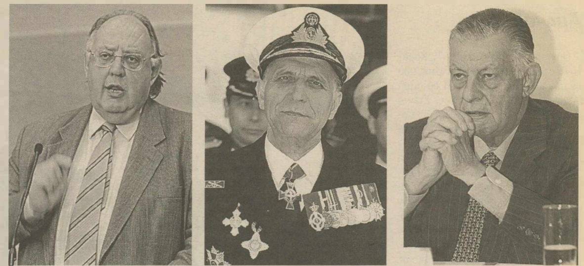
Θ. ΠΑΓΚΑΛΟΣ ΚΑΙ Χ. ΛΥΜΠΕΡΗΣ. Δύο από τους πρωταγωνιστές της νύχτας των Υγίων. Την προσπάθεια για τη συνεργασία των κλάδων στις Ενοπλές Δυνάμεις, που είχε ξεκινήσει ως υπ. Αμυνας ο κ. Ι. Βαρβιτσιώτης, την εγκατέλειψε το ΠΑΣΟΚ.