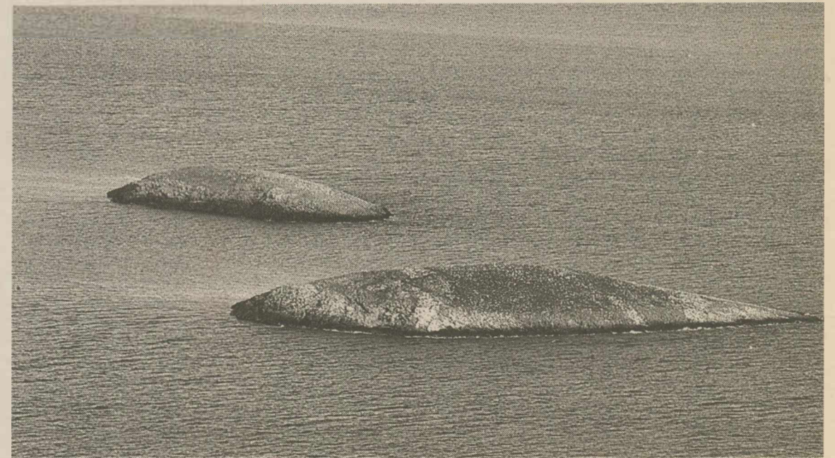
ΟΙ ΔΥΟ ΒΡΑΧΟΝΗΣΙΔΕΣ στα Ύμια. Από εκεί ξεκίνησε η μακρινή νύχτα.

του Γενικού Επιτελείου τρέλανε τον πρωθυπουργό» (υπερτίτλος). Το δημοσίευμα συνεχίζεται και σε εσωτερική σελίδα με τον οκτάστιλο τίτλο «Οι αναμνήσεις του Σημίτη για το Καρντάκ». « VATAN »: «Ομολογία για το Καρντάκ μετά από 9 χρόνια» και «Ενημερωθήκαμε από τον Στέιτ Ντιπάρτμεντ για την απόβαση των Τούρκων καταδρομών στη βραχονησίδα απέναντι στο Καρντάκ μετά από 4 ώρες» (υπότιτλος). Το δημοσίευμα συνεχίζεται ολοσέλιδα σε εσωτερική σελίδα. « RADIKAL »: «Ομολογίες από τον Κώστα Σημίτη» (πολύστιλος σε εσωτερική σελίδα). « AKSAM »: «Εμαθε από τις ΗΠΑ την απόβαση στο Καρντάκ» (εσωτερική σελίδα). « SABAH »: «Σημίτης: Εμαθα από τις ΗΠΑ για την κρίση στο Καρντάκ» (μονόστιλο εσωτερική σελίδα).