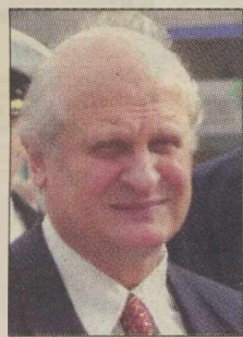
Του ΑΝΤΩΝΗ ΣΚΥΛΛΑΚΟΥ*

Το θέμα της διαφθοράς είναι, για μακρύ χρονικό διάστημα, πρώτο στην «ατζέντα» της πολιτικής αντιπαράθεσης και πρώτο θέμα στα ΜΜΕ. Την ίδια στιγμή μια σειρά άλλα ζητήματα πολύ πιο σοβαρά, που απασχολούν έντονα τα λαϊκά στρώματα όπως η ανεργία, η λιτότητα, η εμπορευματοποίηση της Υγείας και της Παιδείας, τα ζητήματα εξωτερικής πολιτικής και τόσα άλλα, μπαίνουν σε «δεύτερη μοίρα». Πού οφείλεται και πως συντελείται αυτός ο αποπροσανατολισμός;