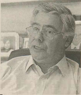
Ο ΠΡΩΗΝ ΠΡΟΕΔΡΟΣ της Ν.Δ. Μιλτιάδης Εβέρτ.

Ο κ. Εβέρτ σπλήνισε την επιλογή του Κ. Σημίτη να αποκαλύπτει μυστικά του στρατού, παρέκτονας με αυτόν τον τρόπο όπλα στην τουρκική πλευρά, ενώ άσκησε και δριμεία κριτική στον πρώην πρωθυπουργό για την απόφασή του να μην επιδείξει τον παραμικρή διάθεση αυτοκριτικής στο βιβλίο του. «Δεν είναι δυνατόν να είσαι ηγέτης και να επιρρίπτεις ευθύνες για όλα στους άλλους», σημείωσε χαρακτηριστικά ο κ. Εβέρτ επικρίνοντας τον κ. Σημίτη και για την άποψη που διατυπώνει στο βιβλίο του ότι οι εκλογές του 2004 χάθηκαν για το ΠΑΣΟΚ την προεκλογική περίοδο. «Οι εκλογές είχαν χαθεί πολύ πριν», είπε.