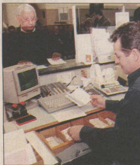
ΕΠΙΜΕΛΕΙΑ: ΔΗΜ. ΓΙΑΝΝΑΚΟΠΟΥΛΟΣ

τους Έλληνες οφειλέτες του Δημοσίου. Και λέμε για κοινόχρηστο, αφού το ίδιο το Δημόσιο απαγορεύεται να εγγυηθεί σε οποιοδήποτε βαθμό, σύμφωνα με τις επιταγές της Ευρωπαϊκής Ένωσης. Το ζήτημα πάντως σε κάθε περίπτωση είναι με ποιον τρόπο θα εισπραχθούν από τους μεγαλοοφειλέτες αυτά τα λεφτά, γιατί οι ψυχραιμότεροι του υπουργείου Οικονομίας υποστηρίζουν πως εάν υπήρχε έστω και μία περίπτωση να τα μαζέψουν θα το είχαν κάνει κατά το παρελθόν. Εμείς προειδοποιούμε για να μην έχουμε δράματα και εκρηκτικά μείγματα στην οικονομία.