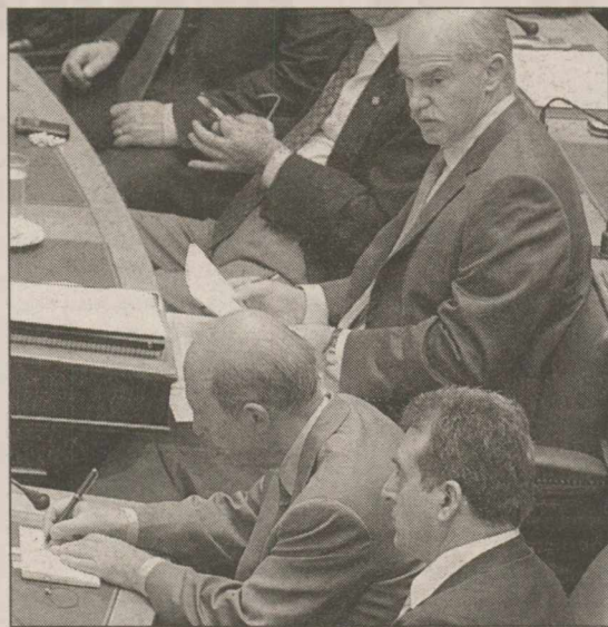
Εξοργισμένος ο αρχηγός του ΠΑΣΟΚ από τις αναφορές του πρώην πρωθυπουργού για τον τρόπο αλλαγής της ηγεσίας στο κόμμα

Το βιβλίο του Κώστα Σημίτη έχει προκαλέσει πονοκέφαλο στη Χαριλάου Τρικούπη αλλά και στα στελέχη του ΠΑΣΟΚ, τα οποία χθες σωρηδόν τον κατηγορήσαν ανοικτά χρησιμοποιώντας φράσεις όπως «ο τιμονιέρης ενός σκάφους που το αφήνει δεν πρέπει να ομιλεί, για όλα φταίει οι άλλοι και όχι εκείνος κ.ά.». Επίσης δεν παρέλειψαν να τονίσουν με έμφαση πως ακόμα και τώρα εμφανίζει τον εγωκεντρισμό του από το γεγονός πως θα παρουσιάσει μόνος του το βιβλίο! Θύμιζαν δε τους χαρακτηρισμούς Καραμανλή στο πρόσωπό του όταν τον αποκαλούσε «αρχιερέα της διαπλο-