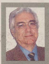
Του ΔΗΜΗΤΡΗ Κ. ΣΕΡΓΙΟΥ

Έχοντας υπόψη όσα έχει γράψει και όσα έχει πει κατά καιρούς ο πρώην αρχηγός ΓΕΕΘΑ ναύαρχος Λυμπέρης, για τη δραματική νύχτα των Ιμίων, προσπαθώ να βγάλω διασταυρούμενο συμπέρασμα διαβάζοντας και όσα επιθετικά κατά του ναύαρχου γράφει ο πρώην πρωθυπουργός κ. Σημίτης στα απομνημονεύματά του. Που, ως γνωστόν, κυκλοφορούν εντός της εβδομάδας.