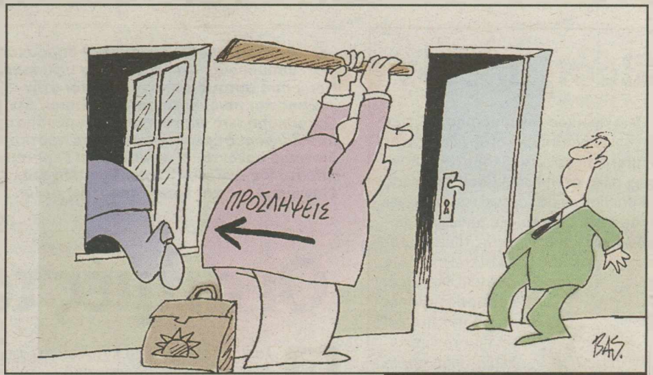
Του ΒΑΣ. ΜΗΤΡΟΠΟΥΛΟΥ

Ο ΛΑ συγκλίνουν στην εκτίμηση ότι ο πρώην "καταλληλότερος" κ. Σημίτης διάλεξε τη σημερινή συγκυρία να κάνει την εμφάνισή του, μέσω του βιβλίου του, με έναν και μοναδικό στόχο: Την επιστροφή του στην πολιτική - και στο ΠΑΣΟΚ!