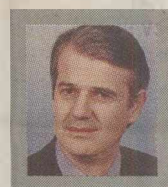
Του ΔΗΜΗΤΡΗ ΤΣΙΑΚΑ (Συγγραφέας)

Ήταν κάποτε μια χώρα που αφού, μετά από τετρακόσια χρόνια αποτίναξε από πάνω της τον τουρκικό ζυγό, προσπάθησε εξουθενωμένα πνεύματικά και ψυχικά να σταθεί στα πόδια της. Τα πρώτα χρήματα που δανείστηκε για να ορθοποδήσει από την άθλια οικονομική κατάσταση στην οποία ευρίσκονταν, έμειναν γνωστά ως και σήμερα σαν τα περιβόητα δάνεια της Αγγλίας. Αυτά τα δάνεια έγιναν αμέσως η αφορμή να συγκεντρωθούν στο Ναύπλιο, που ήταν τότε η πρωτεύουσα της χώρας, κάθε λογής παρατρεχάμενοι, τύποι μυστηριώδεις και αινιγματικοί, κάθε καρδιάς καρύδι, που στο μάκρος του χρόνου εξελίχθηκαν στα σημερινά λαμόγια. Από τότε το λάδι και το κάθε μορφής λιπαντικό, από το δόλιο χρήμα ως το δουλοπρεπές σώμα, κυλίστηκαν σε τσέπες, σε κρεβάτια και ασύδοτα φαγοποτία, χοντροκομμένα και ξεδιάντροπα. Η νέα κοινωνία διέπονταν από την «ιδεολογία» της αρπαχτής, της μαγκιάς, της αλαζονείας, της έπαρσης και της κομπορρημοσύνης. Αρχές και αξίες της ήταν η διαφθορά, η διαπλοκή, η διαπομπή, η δολιότητα και προπάντων η συκοφαντία και η ρουφιανιά. Κι όταν η μπόχα γέμιζε κάθε μύτη και η αδικία θόλωνε κάθε μάτια και σκέψη αλλοιώνοντας τις συνειδήσεις, ήρθε ένας άλλος Μακεδόνας με στόχο να ξεκαθαρίσει το τοπίο, κυνηγώντας τα τρωκτικά και τα αρπαχτικά ακόμα και στο δικό του σπίτι, δείχνοντας μηδενική ανοχή. Στάση ίσια, καθαρή και παλικαρίσια. Κι έγινε αμέσως σεισμός και καταποντισμός. Όλοι οι γραικύλοι ξεμύτισαν