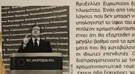
Πρόεδρος της Ευρωπαϊκής Επιτροπής, κ. Ζοζέ Μανουέλ Μπαρόζο.

Παρ' όλο που το ελληνικό πρόβλημα δεν βρίσκεται στην ατζέντα της συνόδου κορυφής, αναμένεται να συζητηθεί κατά τη διάρκεια του δείπνου των αρχηγών κρατών. Το πρώτο σημείο που θα πρέπει να συμφωνηθεί, δεδομένου ότι πιθανότατα θα αποτυπώνεται και στο κείμενο των συμ-περασμάτων, είναι η πολιτική διαβεβαίωση πως η Ευ-ρωζώνη θα καλύψει το κενό χρηματοδότησης του ελλη-νακού προγράμματος. Το κενό διάστημα που θα καλύπτεται το νέο πακέτο δεν μπορεί να προσδιοριστεί, ενώ το ύψος του υπολογίζεται σε 90-120 δισ. ευρώ, δήλωσε χθες στις