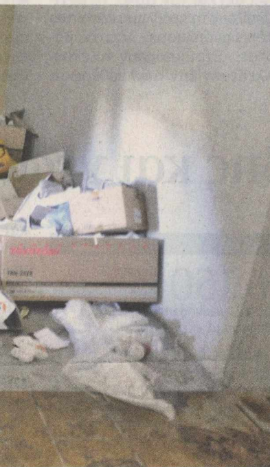
ραμένει οξύ εδώ και δύο χρόνια.

όλων των υπηρεσιακών μεταβολών (διορισμοί, μεταθέσεις, αποσπάσεις) και οριστικής λύσης του ζητήματος των μετατάξεων με τη δημιουργία απαραίτητων οργανικών θέσεων για τους εκπαιδευτικούς ειδικοτήτων. «Βρισκόμαστε ήδη πολύ μετά την ημερομηνία που θα έπρεπε να έχουν πραγματοποιηθεί όλα τα παραπάνω και είναι ορατός ο κίνδυνος να μη μπορέσουν να λειτουργήσουν τα σχολεία στην έναρξη της νέας σχολικής χρονιάς», ανέφερε η ΔΟΕ, με το υπουργείο να απαντά ότι όλα θα λυθούν σε σύντομο χρονικό διάστημα.