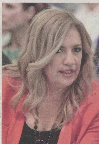
Η κ. Φώφη Γεννηματά

Ο κ. Ν. Ανδρουλάκης ζήτησε επανακαθορισμό της σχέσης του ΠΑΣΟΚ με την κοινωνία, δίχως να επεκταθεί πέρα από τα τυπικά. Αυτός, όπως και όλοι οι βασικοί