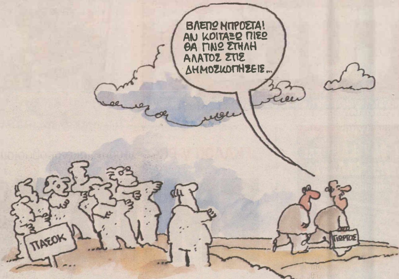
ΤΟΥ ΓΙΑΝΝΗ ΔΕΡΜΕΝΤΖΟΓΛΟΥ