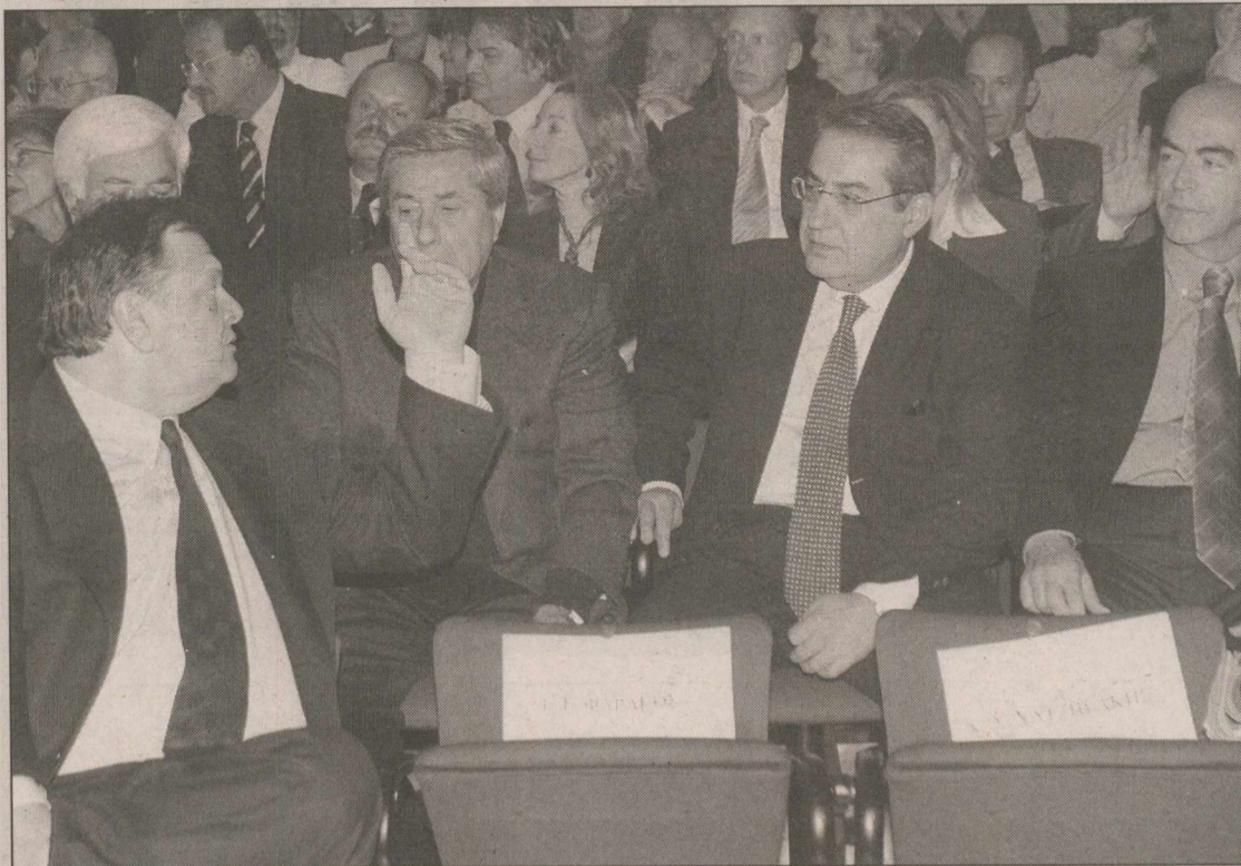
Πίσω μου σας έχω... εκουγχρονιστές

Και ο Μιλτιάδης Εβερτ μίλησε για το βιβλίο του Κώστα Σημίτη, όχι θετικά βεβαίως, θεωρώντας πως ο πρώην πρωθυπουργός έκανε ζημιά στον εαυτό του, αφού, όταν αποφασίζεις να γράψεις απομνημονεύματα πρέπει να τα γράψεις, δεν μπορεί να τα συγκαλύ-