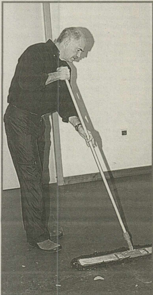
Έτοιμος να πάρει... σκούπα και πάλι ο Γ. Παπανδρέου

Ο ίδιος ο Γ. Παπανδρέου δεν έκρυψε την ενόχληση του, στέλνοντας και ένα σαφέστατο μήνυμα στο εσωτερικό του κόμματος και σε εκείνα τα στελέχη που είναι συνδεδεμένα με το λεγόμενο εκσυγχρονισμό