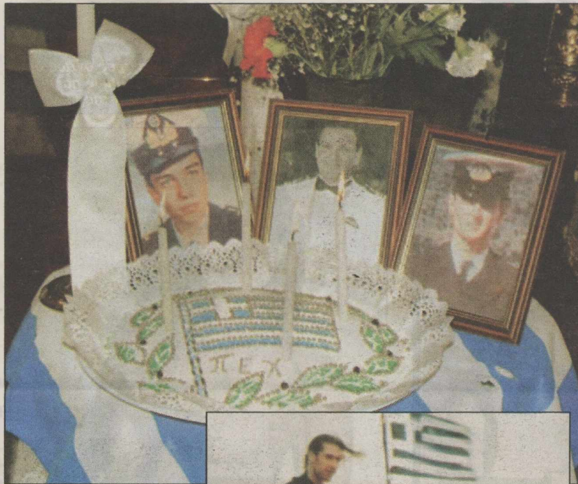
Η αρχή της κρίσης στα Ιμια, με τους Τούρκους να κατεβάζουν την ελληνική σημαία (αριστερά). Φωτογραφία από μνημόσυνο των πεσόντων στα Ιμια (πάνω).