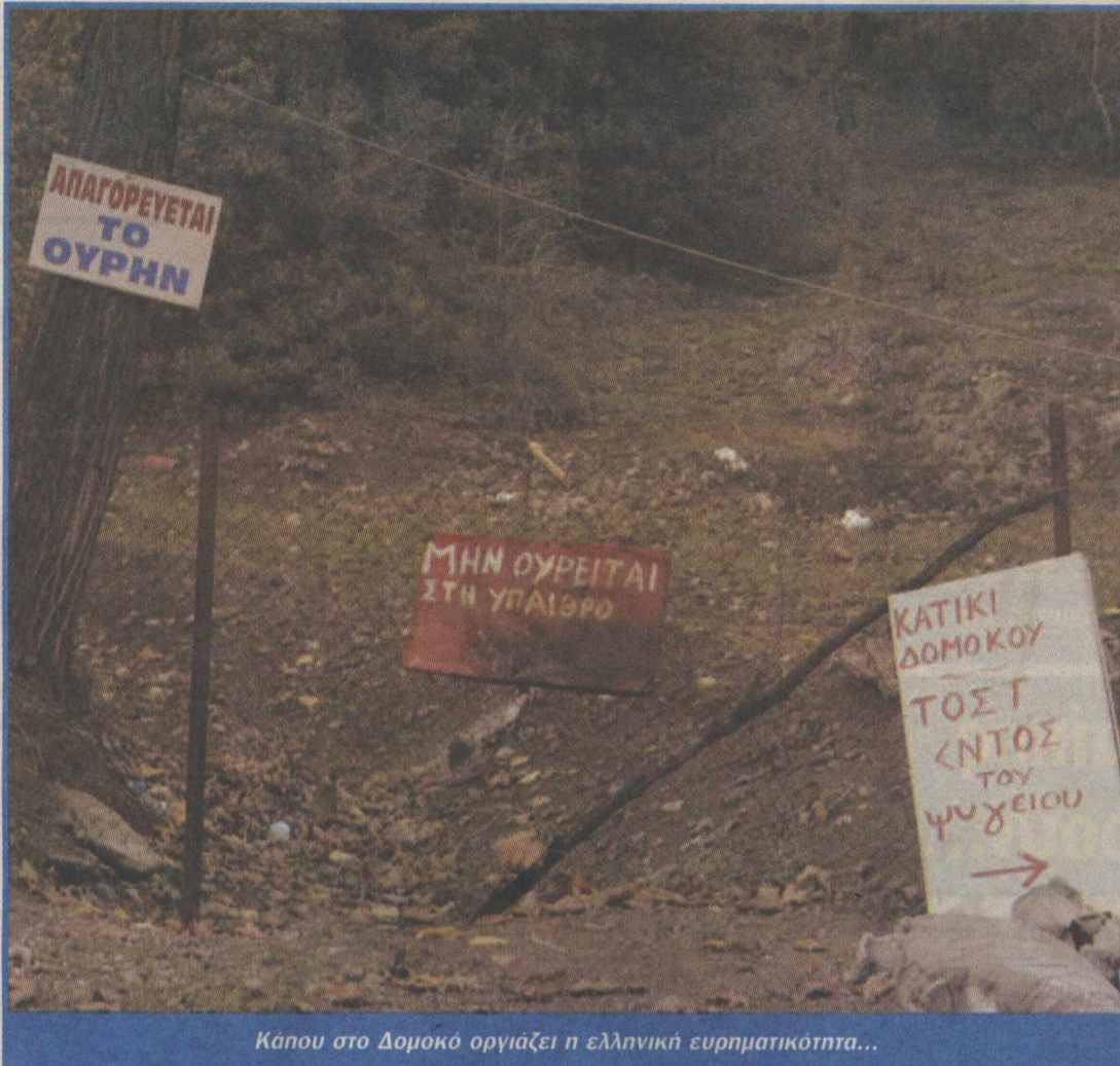
Κάπου στο Δομοκό οργιάζει η ελληνική ευρηματικότητα...

Πρόωρες εκλογές προέβλεψε χθες ο τέως πρωθυπουργός, Κώστας Σημίτης, συνομιλώντας με εκπροσώπους του Τύπου λίγες ώρες μετά την παρουσίαση του βιβλίου του, στην οποία έκανε σαφή την προθεσή του να παραμείνει παρών στα πολιτικά πράγματα. «Η Νέα Δημοκρατία θα βρει αφορμή κάτι μεγάλο και θα προκαλέσει πρόωρες εκλογές» εκτίμησε. «Κι αν ο Γιώργος Παπανδρέου χάσει τις εκλογές;» ρωτήθηκε, για να απαντήσει: «Χτυπήστε ξύλο. Γιατί να τις χάσει;». Πάντως, αν ο ίδιος ο κ. Σημίτης χτύπησε ξύλο ελέγχεται. Όσο για τον Γιώργο, «χτυπιέται» με την επανεμφάνισή.