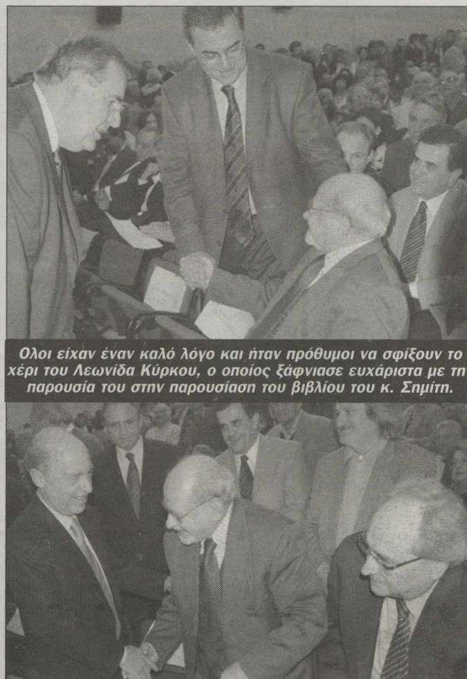
Ολοι είχαν έναν καλό λόγο και ήταν πρόθυμοι να σφίξουν το χέρι του Λεωνίδα Κύρκου, ο οποίος ξάφνιασε ευχάριστα με την παρουσία του στην παρουσίαση του βιβλίου του κ. Σημίτη.

Σε μια από τις σπάνιες δημόσιες εμφανίσεις του, ύστερα από πολύ καιρό, ξάφνιασε με την παρουσία του στην παρουσίαση του βιβλίου του Κώστα Σημίτη