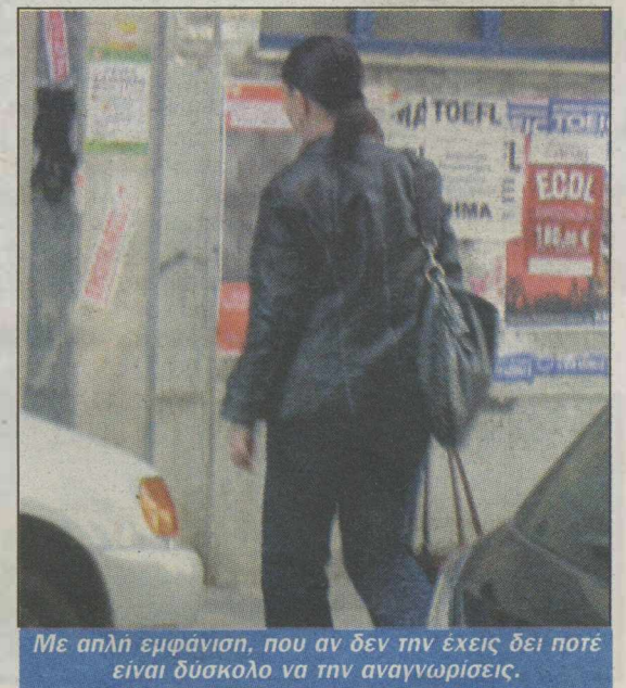
Με απλή εμφάνιση, που αν δεν την έχεις δει ποτέ είναι δύσκολο να την αναγνωρίσεις.