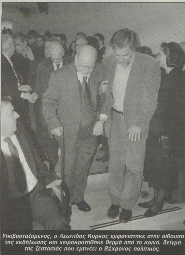
Υποβασταζόμενος, ο Λεωνίδας Κύρκος εμφανίστηκε στην αίθουσα της εκδήλωσης και χειροκροτήθηκε θερμά από το κοινό, δείγμα της ζεστασιάς που εμπνέει ο 81χρονος πολιτικός.

Σε μια από τις σπάνιες δημόσιες εμφανίσεις του, ύστερα από πολύ καιρό, ξάφνιασε με την παρουσία του στην παρουσίαση του βιβλίου του Κώστα Σημίτη