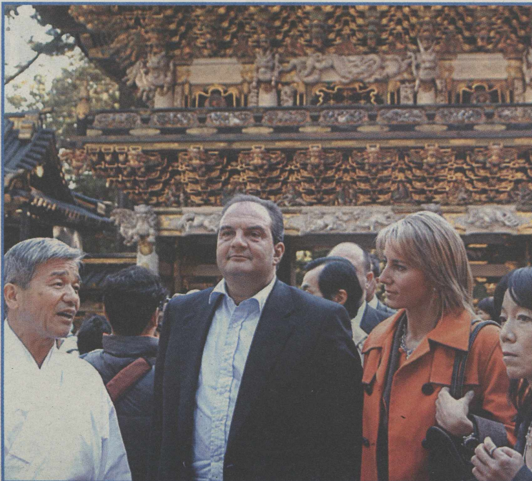
Δυτικά στο βάθος, βλέπετε την Ελλάδα...

Είναι γνωστό ότι έχει αρκετούς εκθρούς ο Δημήτρης Μπλιάκος στην Αθήνα. Τώρα, ο διοικητής της Αγροτικής Τράπεζας και κουμπάρος του πρωθυπουργού μπαίνει στο στόχαστρο και των «πράσινων» αγροτοπατέρων της Θεσσαλονίκης, αφού αποφάσισε να βγάλει στο «σφυρί» τα περιουσιακά στοιχεία της Ομοσπονδίας Γεωργικών Συνεταιρισμών Νομού Θεσσαλονίκης, μήπως και εισπράξει κάτι από τα «φέσια» προς την τράπεζα. Μαθαίνουμε ότι το αντίπαλο στρατόπεδο δεν θα μείνει με σταυρωμένα τα χέρια και αναζητεί τρόπους αντεπίθεσης στον κ. Μπλιάκο, αλλά ο πεισματάρης διοικητής δεν πρόκειται να κάνει πίσω.