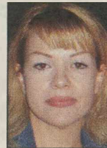
Από τη ΣΟΦΗ ΛΟΥΚΑ

Σας παρακαλώ, κλείστε την τηλεόραση. Έχει αρχίσει πια να με τρομοκρατεί. Και όχι γιατί τα ριάλιτι παιχνίδια μου δημιουργούν μια αίσθηση κλειστοφοβίας ούτε επειδή νομίζω ότι βλέπω την ίδια δραματική σειρά με διαφορετικό καστ κάθε χρόνο. Ειδικά φέτος, είναι αλήθεια ότι υπάρχουν πολλές εναλλακτικές, φρέσκιες ιδέες, που μεταφέρθηκαν έξυπνα στη μικρή οθόνη και από τη πρώτη στιγμή «πήγαν ψηλά» στα περιβόητα τηλενόμια.