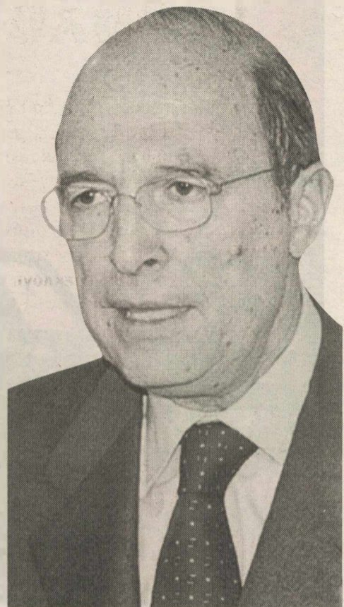
ράβι στις εκλογές της 7ης Μαρτίου του 2004...

Θέλει με λίγα λόγια ο Κώστας Σημίτης να φτιάξει «μηχανισμό» μέσα στο ΠΑΣΟΚ, «μηχανισμό» που θα ελέγχει πράγματα και καταστάσεις, «μηχανισμό» όπου θα συμμετέχουν όσοι πρωταγωνίστησαν επί κυβερνήσεών του, όσοι δηλαδή του στάθηκαν μέχρι και την τελευταία στιγμή πριν πηδήξει πρώτος από το καράβι και αφήσει τον Γιώργο Παπανδρέου να αναλάβει τις τύχες του. Και γνωρίζουμε όλοι ότι βυθίστηκε αυτό το κα-