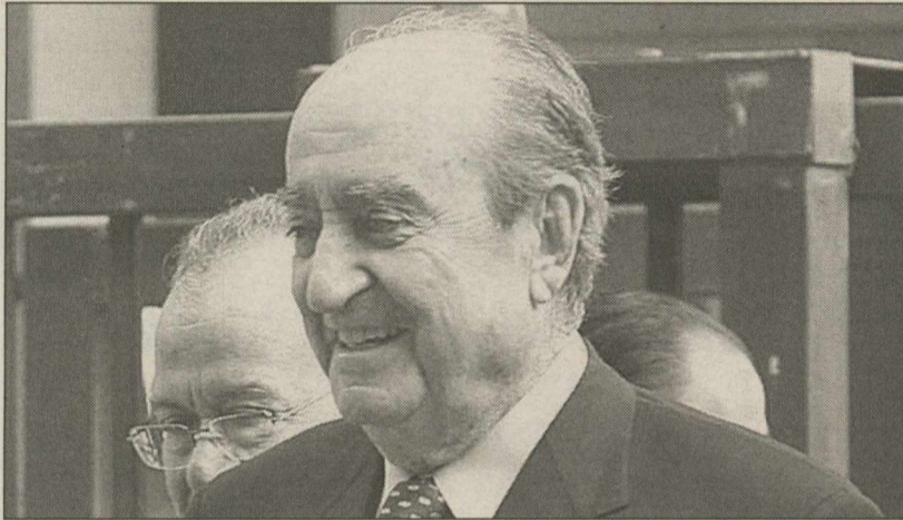
Ο επίτιμος πρόεδρος της Ν.Δ. Κωνσταντίνος Μητσοτάκης χαρακτήρισε «μικρόψυχο» τον τέως πρωθυπουργό Κώστα Σημίτη υποστηρίζοντας ότι με το βιβλίο του ανοίγει ένας κύκλος εσωκομματικής αντιπαράθεσης στο ΠΑΣΟΚ.

Έτσι, ο πρόεδρος του ΠΑΣΟΚ φέρεται να κάλεσε τους συνεργάτες του να κλείσουν το θέμα, ώστε να μην περάσει η αντιπαράθεση στα τοπικά και περιφερειακά στελέχη. Μάλιστα, ο πρόεδρος της ΓΣΕΕ Χρ. Πολυζωγόπουλος σημείωσε: «Εάν συνεχιστεί μια συζήτηση γύρω από αυτό, ίσως δημιουργήσει το πρόβλημα της εσωστρέφειας».