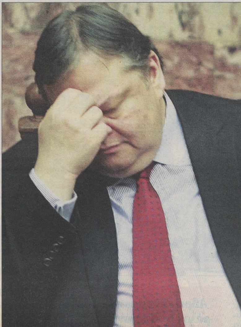
▲ Ο πρόεδρος του ΠΑΣΟΚ Ευάγγελος Βενιζέλος. Αριστερά: Ο βουλευτής Γιάννης Δατσέρης

Βενιζέλου, που αυτήν την περίοδο μοιάζει να παίζει το... μόνος στην Ιπποκράτους. Όπως δήλωσε (egiakoumis.com) ο κ. Δατσέρης, «δεν μπορούσε να συνεχιστεί άλλο αυτή η υπόθεση. Παραιτήθηκα από την Παρασκευή για να μη συνεχιστούν οι αντιδράσεις. Δεν γίνεται κάθε φορά που μιλάω να νομίζουν ότι τα λέει ο Βενιζέλος. Θα συναντηθώ την Τρίτη μαζί του, η απόφασή μου δεν αλλάζει. Φυσι-