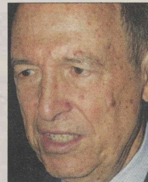
▲ Ο Κ. Σημίτης

Κ. Σημίτης: Φταίνε όλοι εκτός από... εμένα