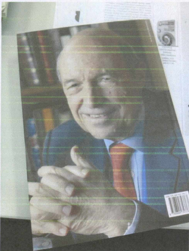
Το οπισθόφυλλο του βιβλίου

Ήδη από το αυτό του νέου βιβλίου του Κώστα Σημίτη, μου ήρθε ναυτία. Ο γνωστός τόνος: του απάμακρου σοφού που σπαράζει για την πτώση της Ελλάδας, αν και αυτός ορθά προειδοποιούσε.