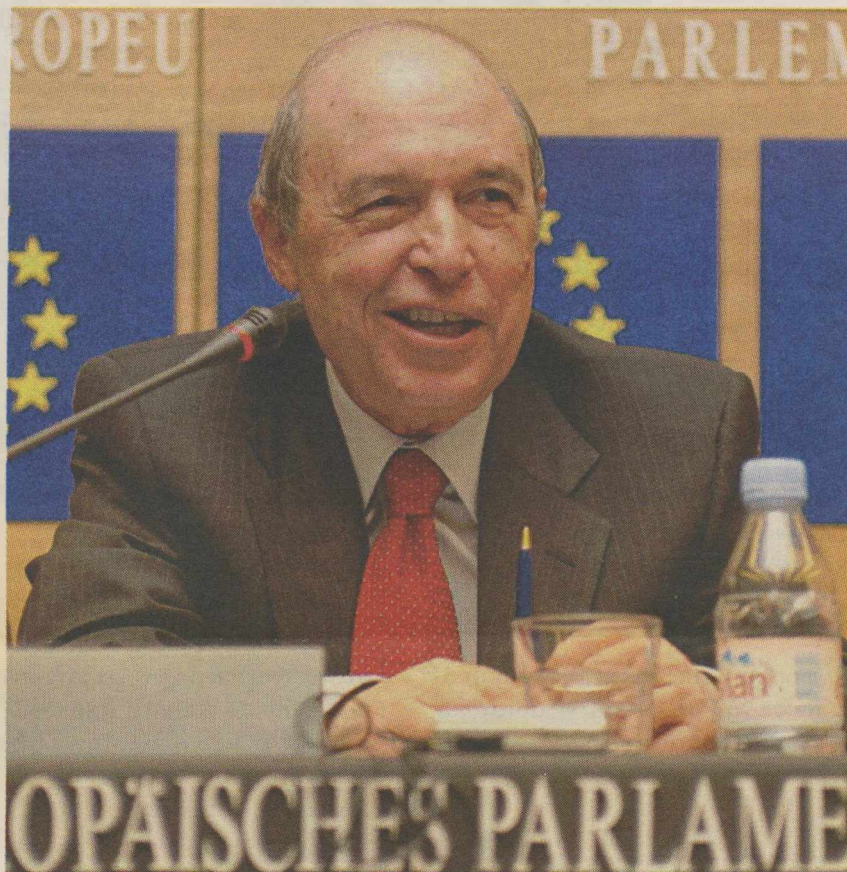
Ο Κώστας Σημίτης.

Το πρώτο, το ξεχωριστό χάρισμα που διέκρινε στον Κώστα Σημίτη ως πρωθυπουργό είναι ότι είχε αυτό που οι Αγγλοσάξονες αποκαλούν strategic thinking : στρατηγική σκέψη. Είχε σαφή στρατηγική άποψη για το πού ήθελε «να πάει η χώρα». Είχε επεξεργασμένο, ολοκληρωμένο σχέδιο. Δεν είχε πολιτικά κόνιες, άτακτες, πλαδαρές «απόψεις» που άλλαζαν από εβδομάδα σε εβδομάδα, από τη μια σύσκεψη στην άλλη, ανάλογα με τις δημοσκοπήσεις ή τις τρέχουσες πολιτικές σκοπιμότητες. Η στρατηγική σκέψη και το σχέδιο που είχε δεν συνιστούσαν απλώς ένα ουτοπικό,