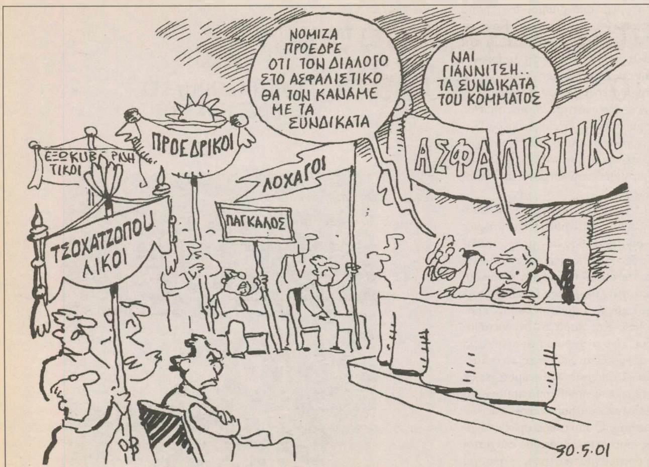
1 Ιουνίου 2001. Το σκίτσο του γελοιογράφου Γιάννη Ιωάννου, που δημοσιεύθηκε στο Έθνος, καταγράφει την έχθρα του βουλευτή ΠΑΣΟΚ προς την απόπειρα του υπουργού Εργασίας Τάσου Γιαννίτση να μεταρρυθμίσει το Ασφαλιστικό.

τικά δομημένους θεσμούς, με ισχυρή κοινή εξωτερική πολιτική και πολιτική άμυνας ικανή να μεγιστοποιεί τα συμφέροντα της Ένωσης και να προστατεύει την ανεξαρτησία και της ακεραιότητα κάθε χώρας μέλους ξεχωριστά. (Ποιος θυμάται, π.χ., ότι ο Κώστας Σημίτης υπήρξε αυτός που επεδίωξε την ενσωμάτωση στη Συνθήκη του Άμστερνταμ της αρχής της προστασίας των συνόρων των κρατών μελών από την Ένωση και της ρήτρας αμοιβαίας συνδρομής στο Ευρωπαϊκό Σύνταγμα που πέρασε στη συνέχεια στη Συνθήκη της Λισσαβώνας, ανεξαρτήτως αν οι ρυθμίσεις αυτές λησμονήθηκαν σχεδόν ολοκληρωτικά, τόσο από την ελληνική όσο και από την ευρωπαϊκή πλευρά στη συνέχεια. Ελπίζω να αναβιώσουν τώρα).