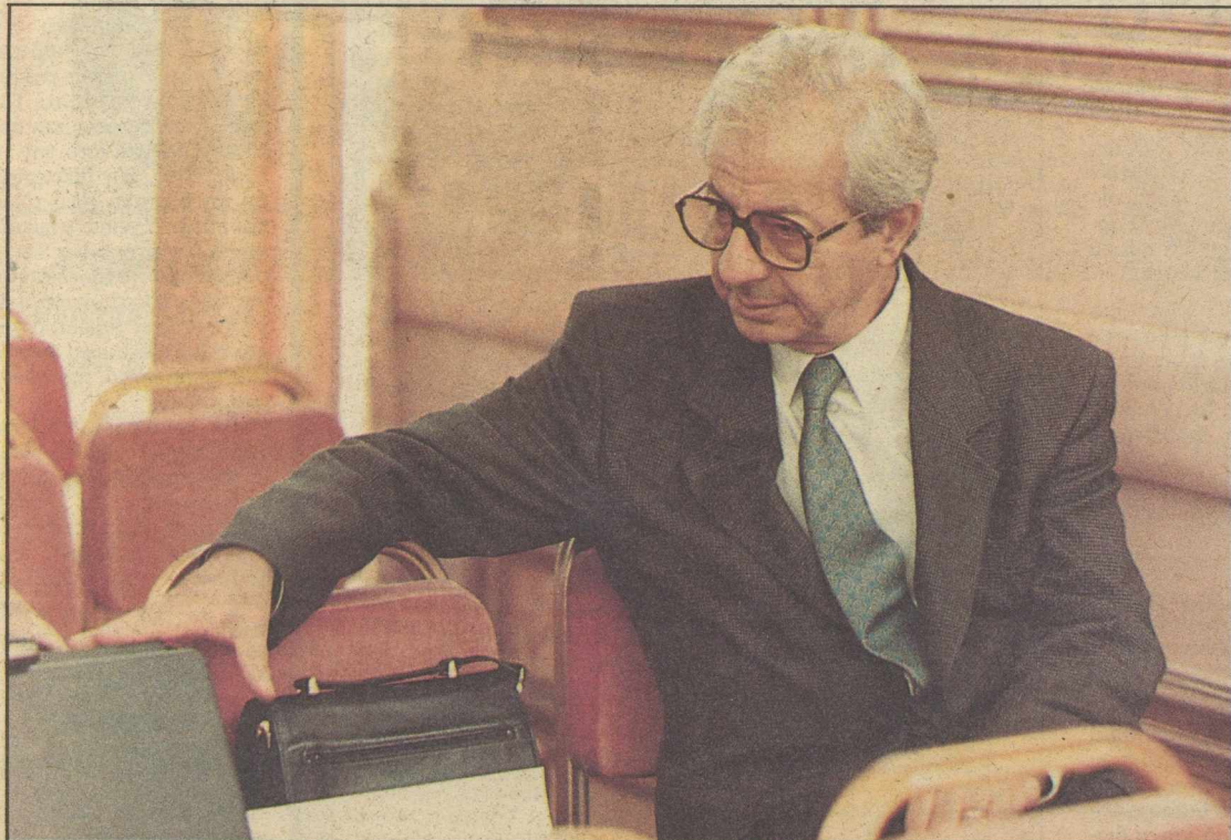
Υπεράνω ομάδων, αλλά με τόλμη κι αποφασιστικότητα ο Παρασκευάς Αυγερινός, μόνος στην αίθουσα, πριν αναμετρηθεί με τον Ανδρέα Παπανδρέου στο πρόσωπο του Ακη