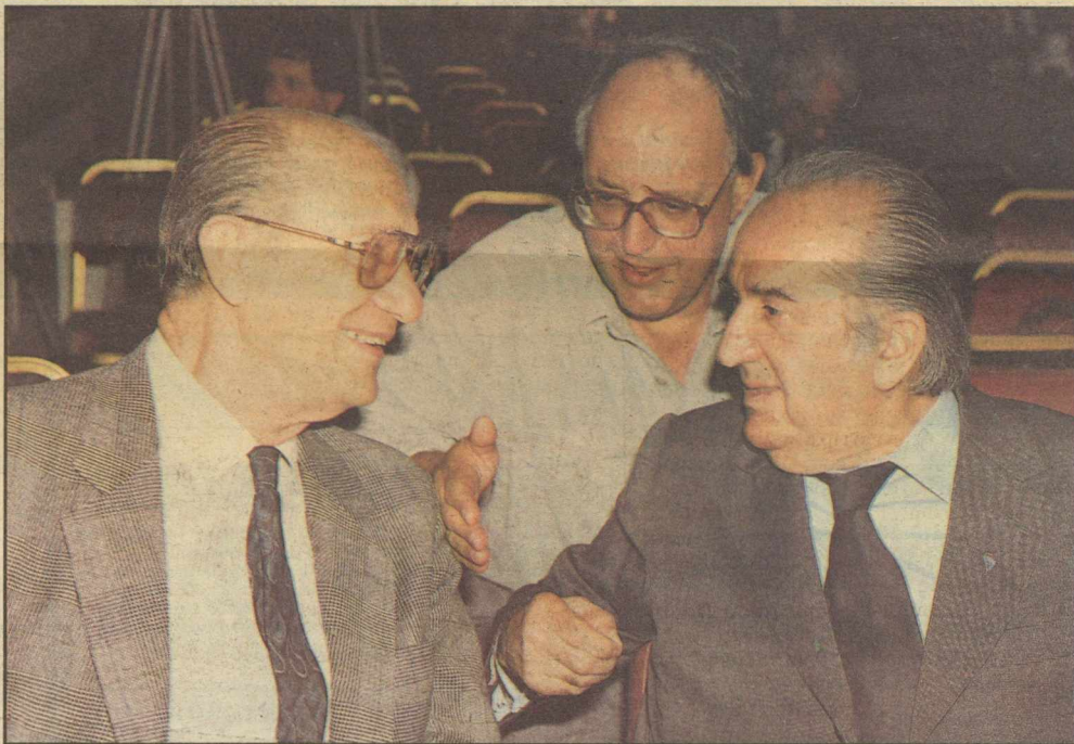
Δεν τον πρότεινε ο Α. Παπανδρέου τον Θ. Πάγκαλο, αλλά αυτός βγήκε τρίτος στο Ε.Γ. Λέτε να εξηγήι στον Γ.-Α. Μαγκάκη και τον Β. Γιαννόπουλο το μυστικό της επιτυχίας;