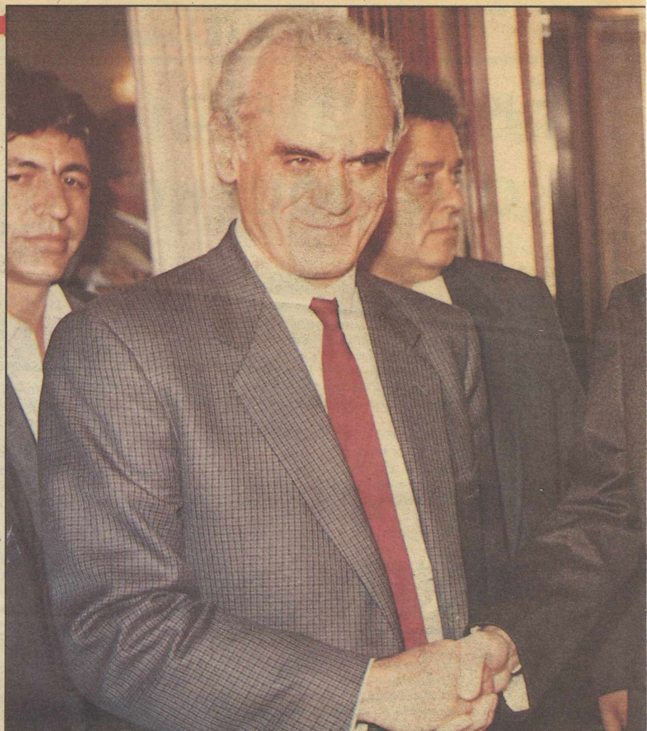
Χαμογελαστοί πρόεδροι κι ευνοούμενος γραμματέας. Δύσκολα, αλλά...