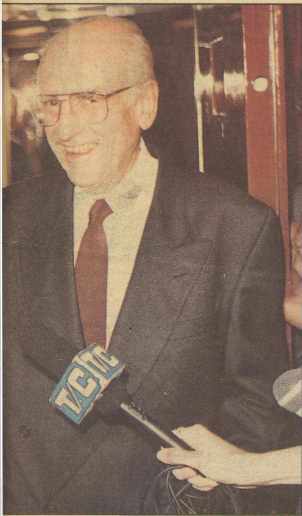
έρδισαν. Εστω κι αν «ταλακώθηκαν» κάπως