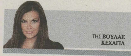
ΤΗΣ ΒΟΥΛΑΣ ΚΕΧΑΪΤΑ

Δεν βάζουν στην ίδια μοίρα με τη γαλάζια παράταξη το ΠΑΣΟΚ και Το Ποτάμι και αφήνουν ανοικτό το παράθυρο για μια μετεκλογική συνεργασία