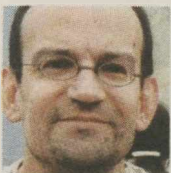
ΤΟΥ ΗΛΙΑ ΚΑΝΕΛΛΗ

ΣΕ ΟΛΗ τη διάρκεια της μακράς Μεταπολίτευσης, ένας μόνο πρωθυπουργός προσπάθησε να δώσει ξεκάθαρα το ιδεολογικό στίγμα του κεντροαριστερού εκσυγχρονιστή. Ήταν ο Κώστας Σημίτης. Η όποια μεταρρυθμιστική ατζέντα του, ωστόσο, έμεινε ανενεργή μετά την ήττα στην προσπάθεια εξορθολογισμού του ασφαλιστικού συστήματος. Και μετά το 2004, στο πάρτι, και ο εκσυγχρονισμός και οι μεταρρυθμίσεις ξεχάστηκαν. Όπως ξεχάστηκε και η ανάγκη μιας σύγχρονης Κεντροαριστεράς.