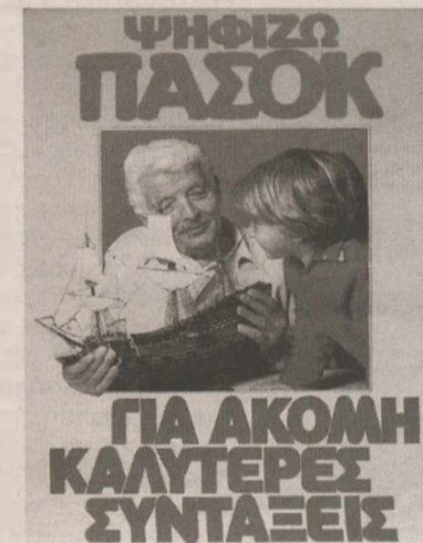
Προεκλογικές αφίσες του ΠΑΣΟΚ στις εκλογές του 1981