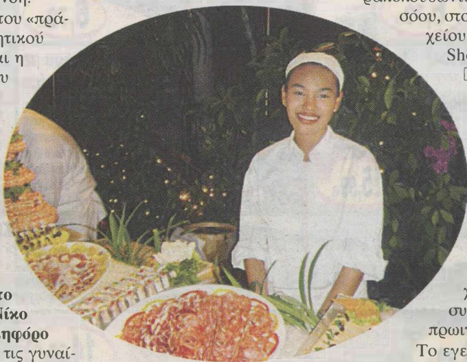
Εκτός από το πρωινό του, «φυσικά, πορτοκαλάδα», ο Κ. Σημίτης απόλαυσε και την τοπική κουζίνα.

□ «Αποκαλύφθηκε ένας πολιτισμός για τον οποίο γνωρίζουμε ελάχιστα. Ήταν ένα από τα ωραιότερα ταξίδια μου» συνόψισε τα συμπεράσματά του ο Κ. Σημίτης, στους συνομιλητές του, μόλις πάτησε το πόδι του στην Ελλάδα.