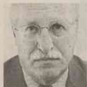
Του Π.Κ. Ιωακειμίδη

ΤΑ ΕΛΛΗΝΙΚΑ παράδοξα και οι παραλογισμοί επιβιώνουν και επαναλαμβάνονται. Γιατί τα όσα συμβαίνουν τελευταία στη χώρα, τι άλλο παρά παραλογισμοί και παραδοξότητες θα πρέπει να θεωρηθούν. Έτσι η Ελλάδα σχεδόν κάθε καλοκαίρι καταστρέφεται από πυρκαγιές. Δάση και ζωές χάνονται. Περιουσίες εξαφανίζονται και το μέλλον της χώρας υποθηκεύεται. Το περιβάλλον τραυματίζεται βάνουσα. Οι πυρκαγιές, με άλλα λόγια, συνιστούν μείζονος