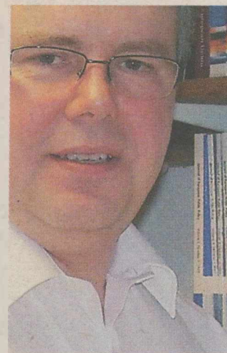
ΚΕΒΙΝ ΦΕΔΕΡΣΤΟΝ Κάτοχος της έδρας «Ελ. Βενιζέλος» και διευθυντής του Ελληνικού Παρατηρητηρίου και του Ευρωπαϊκού Ινστιτούτου του London School of Economics, με πλούσιο συγγραφικό έργο για την Ελλάδα