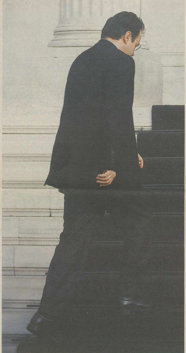
Τα χαλιά θα φορολογηθούν;