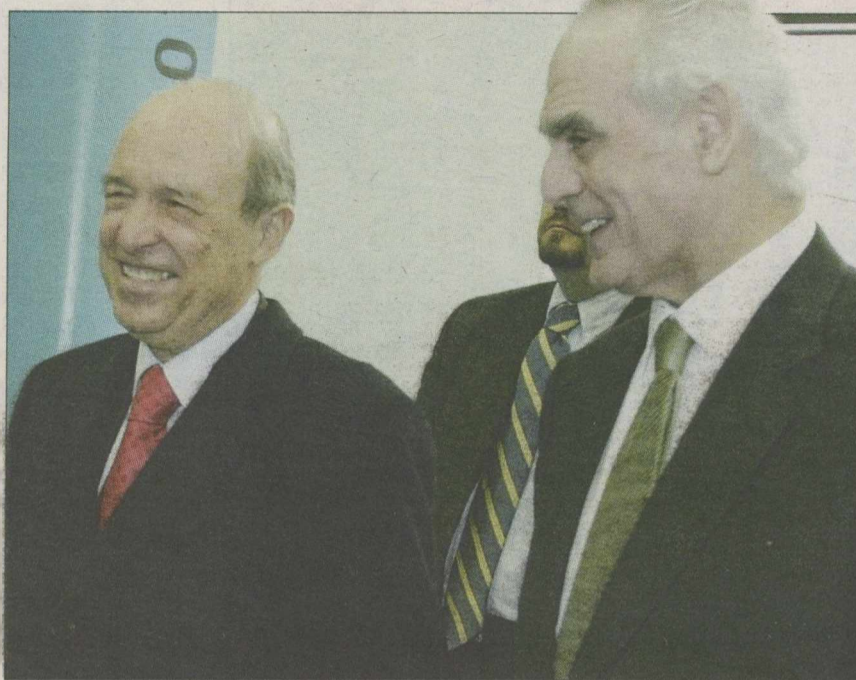
Ο πρώην πρωθυπουργός Κώστας Σημίτης με τον πρώην ΥΕΘΑ Αση Τσοχατζόπουλο

Ο κ. Σημίτης, σε ρόλο «δεν ξέρω, δεν ακούω τίποτε», επί τόσες ημέρες κατά τις οποίες οι αποκαλύψεις πέφτουν σαν το χαλάζι, δεν έχει βγάλει κίχ για όσα συνέβαιναν επί της παντοδυναμίας του. Πιστεύει ότι με αυτόν τον τρόπο θα διατηρήσει την υστεροφημία του ως τεχνοκράτης και... σοβαρός πρωθυπουργός, την ώρα που όλα δείχνουν ότι τα άνθη του κακού έπνιξαν τον κήπο της Ελλάδας, αφού ποτίζονταν επεικώς από το περιβάλλον του, χωρίς ο ίδιος να κάνει τίποτε, επιλέγοντας τον ρόλο του τροχονόμου. Οι ευθύνες του, όμως, κάθε μέρα μεγαλώνουν, ενώ όσα αποκαλύπτονται σφίγγουν τον κλοιό και για τις δικές του ευθύνες. Συγκλονιστικά στοιχεία, τα οποία οδηγούν στην αποκάλυψη του κυκλώματος των μιζών που διοικητεύονταν επί χρόνια στους εμπλεκόμενους με τους αμυντικούς εξοπλισμούς, έδωσε ο προφυλακισμένος πρώην αναπλη-