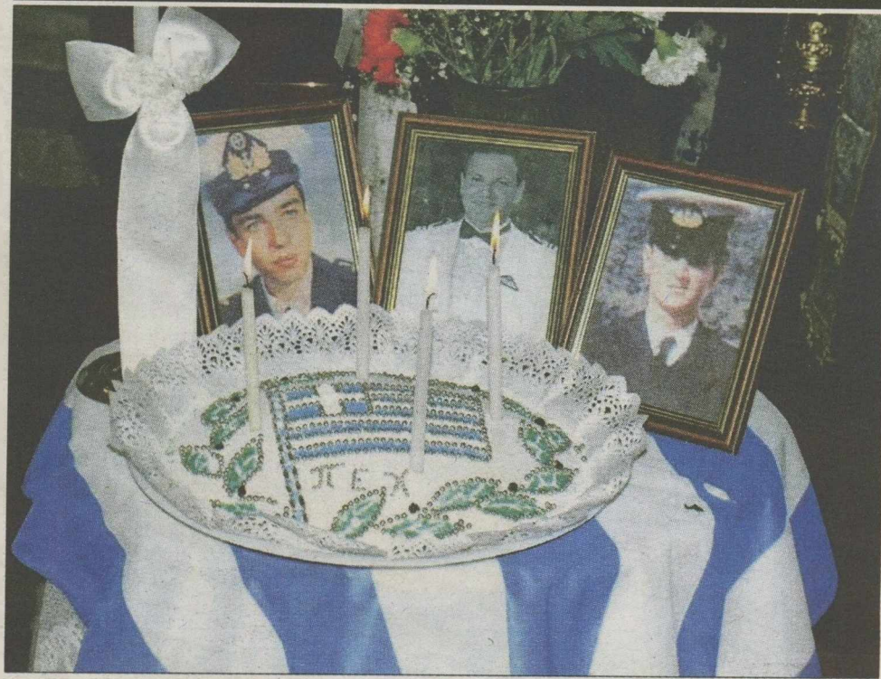
Οι τρεις πεσόντες στα Ιμια (από αριστερά), ο αντιπλοίαρχος Παναγιώτης Βλαχάκος, ο αντιπλοίαρχος Χριστόδουλος Καραθανάσης και ο σημαιοφόρος Εκτορας Γαλιούφης

Και συνάντηση με Σαμαρά ΜΕ ΕΚΠΡΟΣΩΠΟΥΣ των οικογενειών των πεσόντων πρώων των Ιμίων θα συναντηθεί σήμερα ο πρωθυπουργός Αντώνης Σαμαράς. Η συνάντηση θα πραγματοποιηθεί στις 14.30 στο Μέγαρο Μαξίμου, με αφορμή τη θλιβερή επέτειο, 18 χρόνια μετά τη σπηλιά που ο Παναγιώτης Βλαχάκος, ο Χριστόδουλος Καραθανάσης και ο Εκτορας Γαλιούφης βρήκαν τραγικό θάνατο, ύστερα από την πτώση του ελικοπτερού στο οποίο επέβαιναν. Η συγκεκριμένη συνάντηση έχει έντονα συμβολικό χαρακτήρα, καθώς, όπως λένε στην κυβέρνηση, θέλουν η Πολιτεία να διατηρεί τη μνήμη των τριών πρώων άσβεστη στις καρδιές των Ελλήνων, και το θάρρος και η φιλοπατρία τους να αποτελεί παράδειγμα προς όλους.