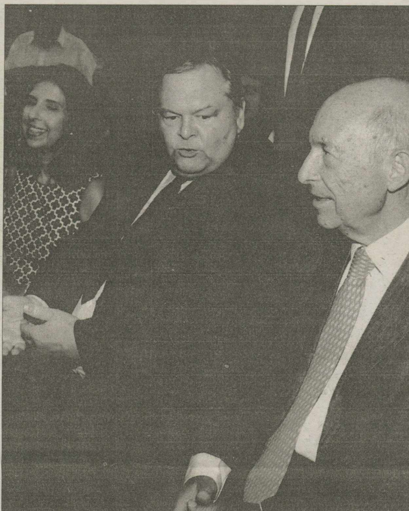
Ο πρόεδρος του ΠΑΣΟΚ Ευάγγελος Βενιζέλος με τον πρώην πρωθυπουργό Κώστα Σημίτη στη χθεσινή εκδήλωση για τα 40 χρόνια του ΠΑΣΟΚ

Αυτό, βέβαια, δεν εμπόδισε τον πρόεδρο του ΠΑΣΟΚ να κάνει το... κομμάτι του, με αιχμηρές ατάκες προς τον κ. Παπανδρέου όπως «του φευγάτου η μάνα δεν έκλαψε ποτέ», «λυπάμαι που δεν είναι εδώ ο κ. Παπανδρέου, βρίσκεται σε σεμινάριο της Royal Bank of Scotland!» Την ίδια ώρα, πάντως, προειδοποίησε με αφορμή το περιστατικό της Δευτέρας ότι εξαντλείται η υπομονή του, διατυμπανίζοντας όμως ότι «επιτελεί καθήκον»! «Αυτά που είπα τη Δευτέρα χάθηκαν μέσα στην ευτέλεια συμπεριφορών που δεν έχουν σχέση με τη δημοκρατία, τον πολιτικό πολιτισμό, μέσα σε συμπεριφορές που προσβάλλουν την παράταξη και βιάζουν τις θεμελιώδεις δημοκρατικές αξίες» είπε αρχικά ο κ. Βενιζέλος, ενώ συμπλήρωσε ότι αυτά τα περιστατικά δεν τον αφορούν προσωπικά, καθώς δεν μετείχε προσωπικά και ιδιωτικά στην εκδήλωση, αλλά ως πρόεδρος του ΠΑΣΟΚ. Προσπάθησε δε να πείσει ότι έκανε τα πάντα για το κόμμα λέγοντας: «Επιτελώ καθήκον με πολύ σαφείς στόχους για συγκεκριμένο διάστημα. Δεν δέχομαι ότι ισχύουν και αναπαράγονται οι αθλιότητες του 2007,