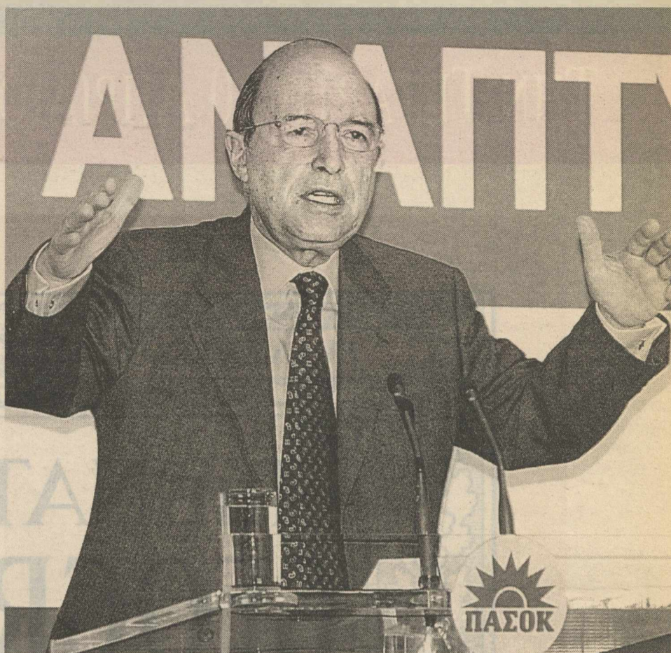
«Ο Σημίτης δεν αποφασίζει ποτέ υπό πίεση» λένε παράγοντες που συζητούν καθημερινά με τον Πρωθυπουργό

Πολλοί στο ΠαΣοΚ εκτιμούν επίσης ότι στις παρούσες συνθήκες ενισχύεται ο ρόλος της «παλιάς φρουράς» εις βάρος ενός κύκλου προσώπων που συνιστούσαν τον «σημιτικό πυρήνα» του πάλαι ποτέ «εκσυγχρονιστικού μπλοκ» και επρόκειτο να πρωταγωνιστήσουν στο διάστημα ως τις προσεχείς εκλογές, τις οποίες ο κ. Σημίτης τοποθέτησε εκ νέου στην άνοιξη του 2004. Ενας πρόσθετος λόγος είναι και η αναθέρμανση των ιδεών για την υποψηφιότητά του για τη θέση του προέδρου της επόμενης Ευρωπαϊκής Επιτροπής, για τη συντήρηση της οποίας απαιτείται η παρουσία του ως εν ενεργεία πρωθυπουργού.