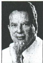
Από τον Γιώργο Κύρτσο gkyrtzos@otenet.gr

Π ώς αξιολογούμε τις εσωκομματικές εξελίξεις στο ΠΑΣΟΚ με βάση τα αποτελέσματα του συνεδρίου; Απόλυτη κυριαρχία Σημίτη, ανάδειξη μιας νέας γενιάς σημαντικών στελεχών, ανάδειξη του Κώστα Λαλιώτη - πιθανόν με τη βοήθεια του Πέτρου Ευθυμίου - σε ρυθμιστή της μελλοντικής διαδοχής, σταθεροποίηση του Γ. Παπανδρέου σε ρόλο θεσμικού «δελφίνου», ο οποίος όμως δεσμεύεται από το «σημιτικό» σύστημα, υποχώρηση της επιρροής του Ακη Τσοκατζόπουλου και της λεγόμενης εσωκομματικής αντιπολίτευσης.