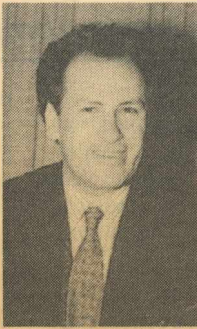
Άρθρο του υπουργού Κώστα Λαλιώτη, μέλους του Ε.Γ. του ΠΑΣΟΚ

Τα παραδοσιακά κόμματα όπως και τα άλλα κόμματα αν θέλουν να ζήσουν οφείλουν να μιλήσουν με παρηγορία πώς και γιατί το «πολιτικό χρήμα» διαδρώνει τους θεσμούς. Το «πολιτικό χρήμα» έχει ένα διπλό σκοπό, να συσσωρεύσει χρήματα-κέρδη με άνομο τρόπο στις επιχειρήσεις και τους μεσάζοντες και να αναπαραγάγει με ακριβοπληρωμένους τρόπους την εξουσία για μια μερίδα πολιτικών και για ορισμένα κόμματα. Γι' αυτή τη «χημική ένωση» πολλές φορές για το ρόλο του καταλύτη χρησιμοποιούνται ορισμένα Μαζικά Μέσα Ενημέρωσης με την ισχύ τους. Έτσι οι «ροές του χρήματος», οι «ροές της χειρα-